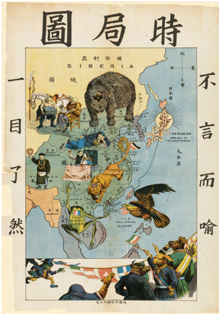
Nach Guafen Zhongguo tu: 瓜分中國圖 [China aufteilen wie eine Melone], in: 俄事警聞, 15.12.1903

Eine zuerst 1898 in Hongkong publizierte Karikatur warnt vor der Bedrohung Chinas: Von Norden drängt der russische Bär, von Osten die japanische Sonne, von Süden der französische Frosch, von den Philippinen der US-Adler. Die britische Dogge liegt im Yangtze-Tal, die „Deutsche Wurst“ ist bereits über die Halbinsel Shandong geworfen, weitere europäische Mächte sind auf dem Sprung. Im Inneren ist das Reich von Korruption und Opiumsucht geschwächt.