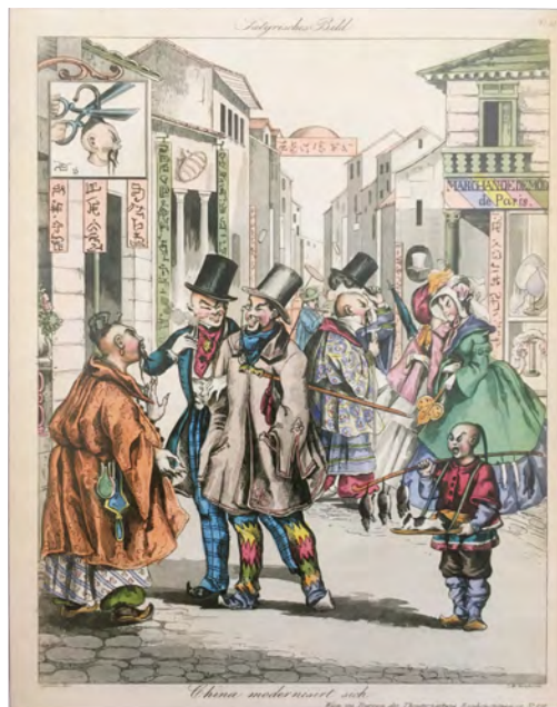
Abb. 2 Joseph Cajetan: China modernisiert sich, in: Wiener Theaterzeitung , 18. Mai 1844, Satyrische Bilder, Nr. 38

Das Cover des US-Satiremagazins Puck zeigt die Allegorie der Zivilisation, verkörpert in einer jungen, hellhäutigen Frau mit Eisenbahn und Telegraphenmast, die China in Gestalt eines Mandarins mit der Schere des „Fortschritts“ den Zopf „abgenutzter Traditionen“ abschneidet.