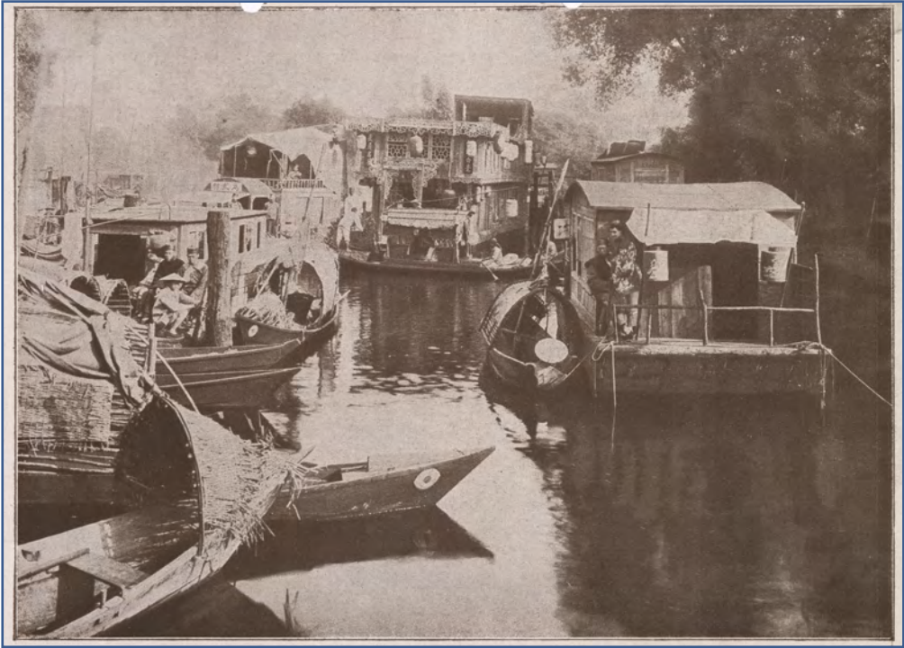
Abb. 1 Der nachgebaute chinesische Hafen mit Blumenboot auf der Havel an der Freundschaftsinsel in Potsdam, in: Licht-Bild-Bühne 44 (1919), 42