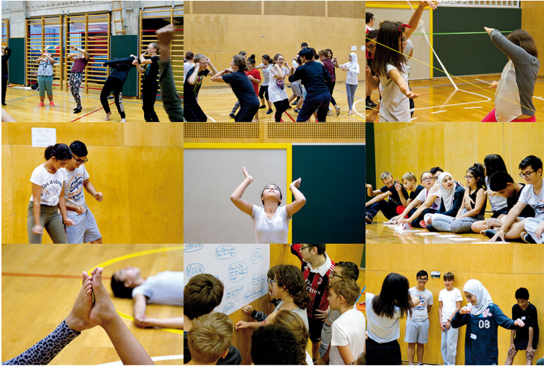
Abb. 3: Impressionen aus den Workshops

Durch diese Art der kunstgeleiteten Bewegungssprache lernten die Schüler*innen zu abstrahieren und eine bestimmte Form der Interpretation anzuwenden. Sie entfernten sich von einer gewissenhaften 1:1-Erzählung und -Darstellung im Tanz und zeigten mehr Bewusstsein für Wahrnehmung im Raum in ihrem unmittelbaren sozialen Handlungsumfeld.