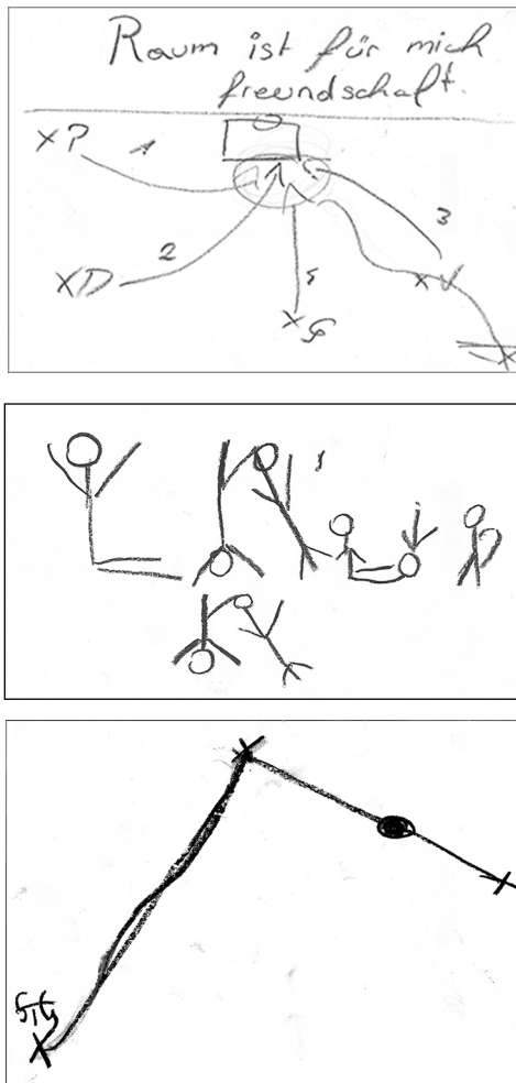
Abbildung 4 a-c: Raumpartituren von Schüler*innen

16 Schüler*innen teilten sich in der Forschungsphase in drei Gruppen und zeichneten ihre Raum-Partituren auf A4-Papiere. Jede Gruppe überlegte, wie sie ihre zuvor formulierten Sätze (z.B. Was ist für dich Raum? Raum ist für mich Freundschaft) als Partitur zeichnen könnten. Sie markierten am Papier jede beteiligte Schüler*in mit einem Anfangs- und Endpunkt und zeichneten die jeweiligen Raumwege ein, bevor sie das gesamte Bild tänzerisch und rhythmisch in den realen Raum transportie-