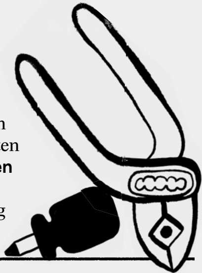
Abb. 1: Reparieren und Selbermachen in Zahlen (eigene Darstellung)

6–7 Minuten pro Tag verbringen Menschen in Mehrpersonenhaushalten mit Reparieren, Warten und Pflegen ihrer materiellen Ausstattung (Stand 2012/13)