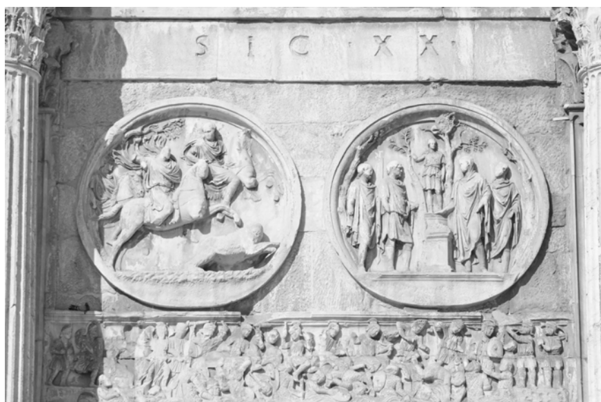
Abb. 3: Detailausschnitt des Konstantinsbogens in Rom, Südseite, über dem rechten Bogen: hadrianische Tondi (Eberjagd und Opfer an Apollon) und konstantinisches Relief (Schlacht an der milvischen Brücke)

Neben den formalen Aspekten des Vergangenheitsbezugs durch die Wahl früherer Bauelemente für die Errichtung des Konstantinsbogens kann, äquivalent zur Frankfurter Treppe, auch ihre inhaltliche Anlage für die Interpretation der Bildbotschaft fruchtbar gemacht werden. Die einzelnen Bilder zeigen die früheren Kaiser bei typisierten Handlungen, etwa der Ansprache vor dem Volk, kriegerischen Taten oder kultischen Handlungen zu Ehren der Götter, und dokumentieren so relevante Tugenden kaiserlicher Herrschaft. Wie heute Staatsoberhäupter und andere Personen in Führungspositionen an ihren Vorgängern gemessen werden, so stellte auch Konstantin sich in eine Reihe von Herrschern, die schon in der Antike zu den sogenannten guten Kaisern gezählt wurden. Gerade aufgrund der stereotypen Darstellungsmuster kaiserlicher Tugenden wird man daher in der Spätantike kein Problem darin gesehen haben, die Köpfe des Konstantin und seines Mitkaisers Licinius in die früheren Reliefs einzuarbeiten. Zugleich waren die Bildhauer bemüht, die beiden Kaiserköpfe auch formsprachlich behutsam einzufügen. So ergibt sich trotz der fragmentierenden Kraft unterschiedlicher Stile ein konzeptuelles Ganzes. Zumindest in der Weihinschrift des Bogens stimmen Volk und Senat zu: Dort wird Konstantin als Befreier von der Tyrannei seines Vorgängers Maxentius gefeiert.