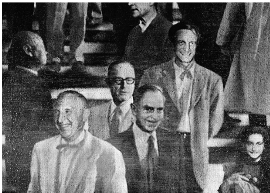
Abb. 2: Detailausschnitt: Nahansicht der »Frankfurter Treppe / XX. Jahrhundert«

Gesichter werden unscharf, Konturen zerfließen und Formen verschmelzen, wobei die einzelnen Baukörper, millimetergroße Mosaiksteinchen und deren Zwischenräume, deutlich hervortreten. Betrachtern wird durch das Spiel zwischen Schärfe und Unschärfe sowie zwischen visueller Einheit und deren sukzessiver Auflösung in kleinste, pixelartige Fragmente die Diskontinuität des Kontinuums medial selbstreferenziell vor Augen geführt.