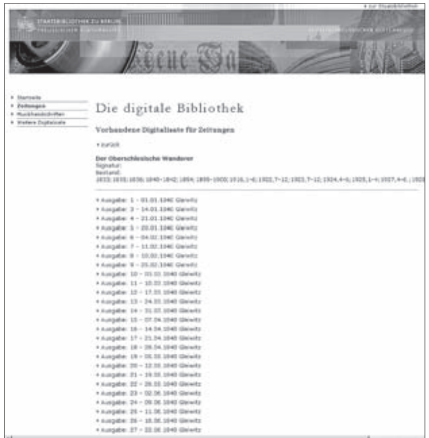
Abb. 5

Doch was geschieht mit den Originalen? Wer bewahrt sie wo und wie auf – geschützt, gesichert, der Benutzung entzogen, aber für exzeptionelle Fälle wie etwa einen Nach-Scan zur Verfügung stehend? Ist es denkbar, das nach über 125 Jahren der Appell von Carl Richard Lepsius doch noch Gehör und die erforderliche finanzielle Ausstattung findet, der Ruf nach der »besondere[n] Institution (...), die über das ganze Land, oder vielmehr Reich sich gesetzlich erstrecken und nur