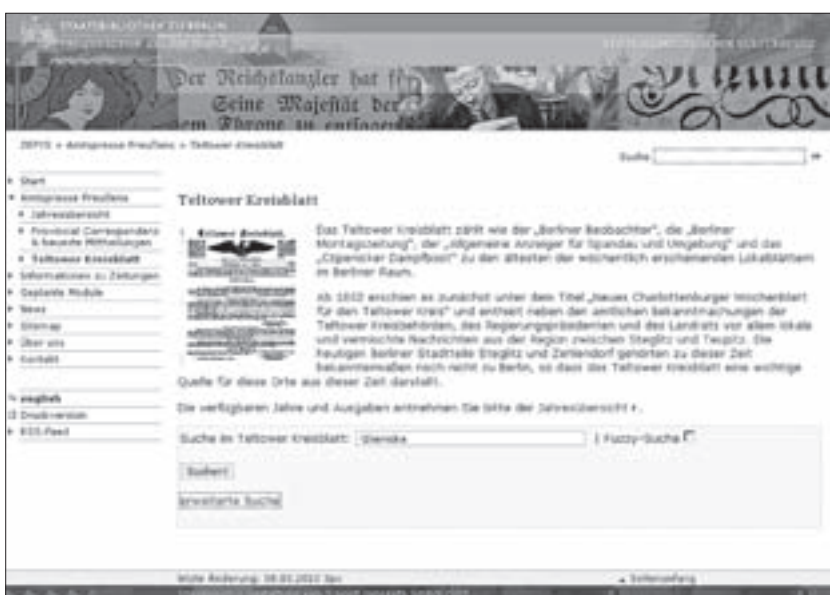
Abb. 4: Teltower Kreisblatt