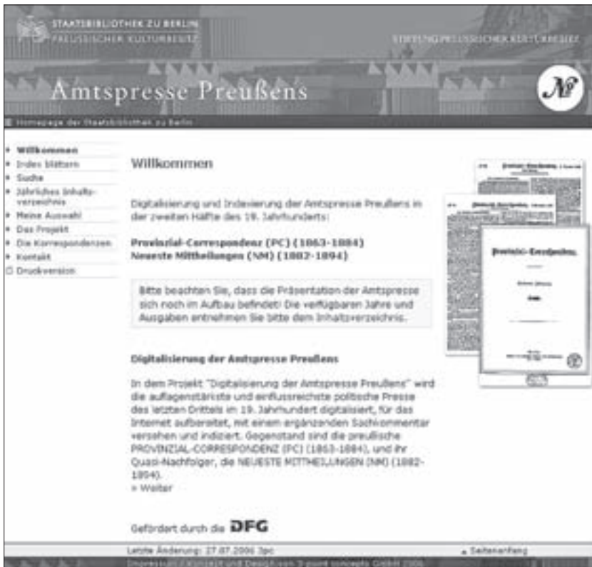
Abb. 3: Amtspresse Preußens