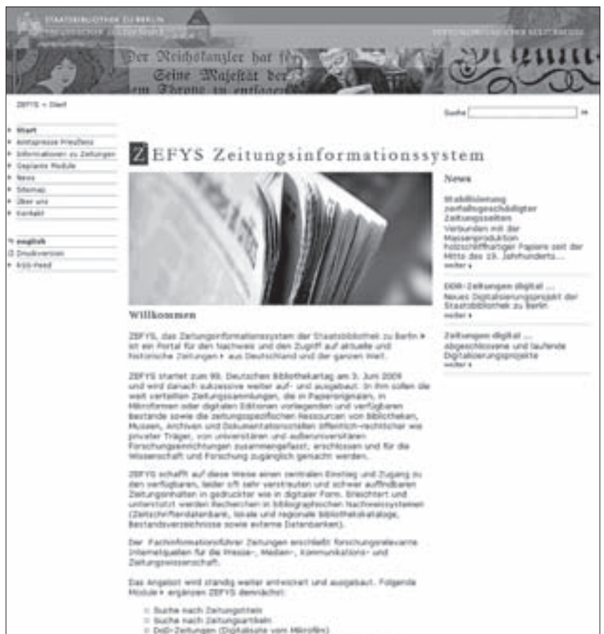
Abb. 2: ZEFYS

Von besonderer und dringlicher Bedeutung ist als erster Arbeitsschwerpunkt das modulare Angebot der Zeitungsdigitalisate mit standardisierten Metadaten für die Erschließung und die einheitliche Präsentation der Digitalisate. Die SBB hat in den letzten Jahren in