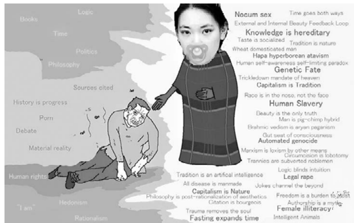
Abb. 5 Miya als Saint Pepe

Ein Meme, das auf einer Miya gewidmeten Website gepostet wurde, veranschaulicht die Nähe zu rechtsextremem Gedankengut: Miyas Gesicht wurde darin auf die Darstellung von Saint Pepe , einer messianischen Version von Pepe the Frog , kopiert (vgl. Abb. 5). Pepe trägt eine braune Kutte und streckt einem weinenden Wojak die Hand entgegen. Im linken Bildraum stehen Begriffe, die die veralteten Ideale des Wojak symbolisieren sollen: Rationalismus, materielle Realität, Philosophie, Politik; rechts predigt Miya-Pepe neue «Wahrheiten» wie «Capitalism is nature», «Circumcision is lobotomy» und «Human slavery». Während sich einige dieser Parolen noch als ironisch überspitzte Reflexionen auf Incel-Kulturen und rechte Verschwörungsnarrative lesen lassen, überschreiten «Legal rape» oder «Female illiteracy» deutlich die Schwelle zum misogynen Gedankengut. Konzepte wie «Hapa Hyperborean Atavism» greifen auf rechtsextreme Diskurse zurück, die um die mythische Region Hyperborea kreisen, welche in der griechischen Antike als sagenhafte nördliche Heimat eines der vier Menschengeschlechter beschrieben und im 19. Jahrhundert von rechten Okkultist*innen zum Ursprung einer «weißen Wurzelrasse»