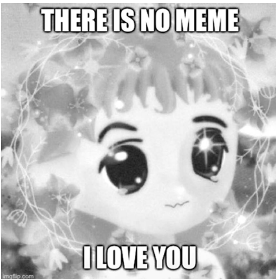
Abb. 6 Elon Musks Repost des Milady-Memes

40 Vgl. Milady Maker [NFT-Kollektion]: OpenSea, www.opensea.io/collection/milady/overview (9.5.2025).