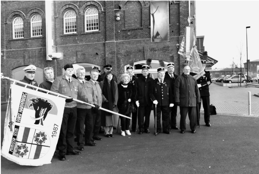
Abb. 2: Einweihung am 31. Januar 2003 zusammen mit Mitgliedern der Grubenwehrkameradschaft, des Knappenvereins, des City-Marketings und des Evinger Geschichts- und Kulturvereins.