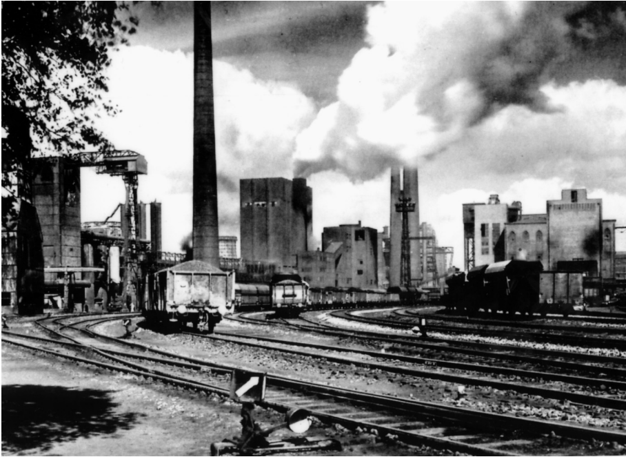
Abb. 8: Minister Stein in den 1950er Jahren

Bei einer Vorführung der Signalglocke, bei der Vertreter der Bezirksvertretung, des City-Marketings, des Geschichts- und Kulturvereins und der Grubenwehrkameradschaft zugegen waren, winkte der Investor des Dienstleistungszentrum unter dem Hammerkopfturm ab: Er verweigerte eine Einwilligung zur Anbringung. Es sollten doch auf keinen Fall angeworbene wie potentielle Mieter durch die Lärmbelästigung abgeschreckt werden!