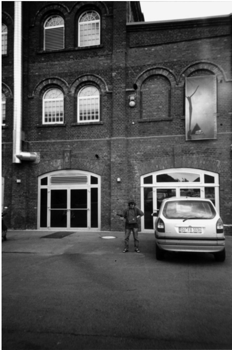
Abb. 9: Die Platzierung der Signalglocke an der Außenmauer der ehemaligen Kaeue (vor Anbringung der Tafel).

für Black-Music-Fans im Revier“. Der Diskothekenbetreiber Tempelmann war vom akustischen Denkmal angetan, er erlaubte die Anbringung und liefert den Strom für die Betreibung der Zeitschaltuhr unter der Auflage, dass die Uhr auch um 21 Uhr schlägt, dem Beginn der Disko. Jetzt klingt die Signalglocke von der ehemaligen Schwarzkaue herunter sehr unpoetisch über eine große Parkplatzfläche, die nächste Wohnbebauung ist mehr als 200 Meter entfernt, dazwischen liegt eine Straßenbahntrasse auf der Evinger Strasse, auch heute noch die Hauptverkehrsader. Das akustische Denkmal strahlt parallel zum neu errichteten Dienstleistungszentrum, durch die Deutsche Straße, Parkplatz- und Freiflächen getrennt.