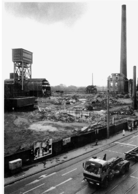
Abb. 4: Nach dem Ende der Förderung begann der Abriss. Rund um „Schacht 4“, hier noch mit der ehemaligen Hängebank, kamen Abrissbirnen und Bagger zum Einsatz.

Zusammen mit den Füllorten unter Tage und der Hängebank über Tage bestand die Kohleförderung aus einer Vielzahl von minutiös aufeinander abgestimmten Arbeitsvorgängen. Der Verständigung dienten verschiedene Signaleinrichtungen wie Signalglocken, elektrische Signaltafeln und Telefone. Die fest vorgeschriebenen Signalzeichen waren auf Anschlagtafeln an den Arbeitsplätzen (im Fördermaschinenhaus, an der Hängebank und an den