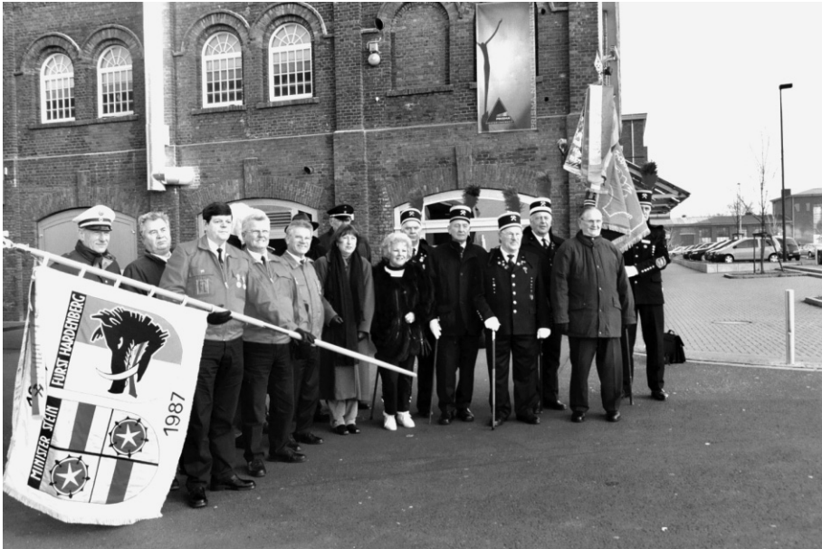
Abb. 2: Einweihung am 31. Januar 2003 zusammen mit Mitgliedern der Grubenwehrekameradschaft, des Knappenvereins, des City-Marketings und des Evinger Geschichts- und Kulturvereins.