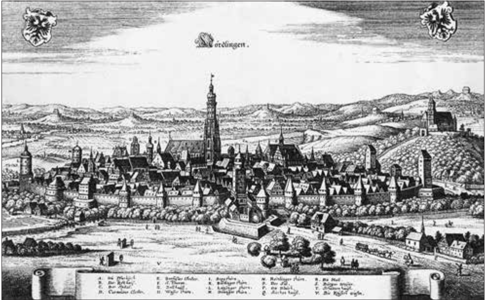
Nördlingen, Kupferstich von Matthäus Merian, 1634/43

sonst wirkte die Stadt nicht unbedingt einladend: Noch Ende des Jahrhunderts musste der Rat Maßnahmen ergreifen, damit Schweine nicht ohne Aufsicht durch die Straßen liefen. 28