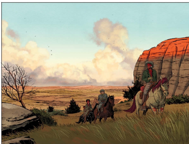
Fig. 23: Construction de la perspective par la couleur dans Hoka Hey 33 .

couleur, la grandeur des éléments et les rapports géométriques notamment, participe à la profondeur de champ. La couleur est, dans ce cas précis, en interrelation avec les éléments constitutifs de la dimension figurative. Dans le cas de la vignette ci-dessous, les deux autres dimensions n'entrent pas en jeu puisqu'elle a été séparée de sa séquence pour servir d'exemple et qu'il n'y a pas de textes.