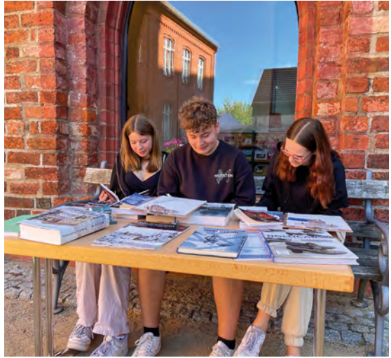
Abb. 3 und 4: Schüler:innen an der Büchertischstation während eines Workshops in Jüterbog, September 2023

Wegner: Viele Perspektiven auf die virtuelle Begegnung (?) mit NS-Zeitzeug:innen