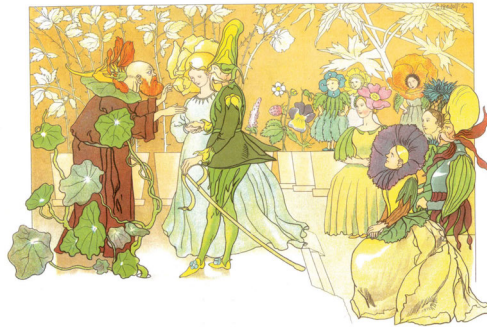
Abb. 4: Die Hochzeit.

Ernst Kreidolf: Blumen-Märchen . [Nachdruck der Ausgabe Köln 1900.] Zug: Ars Edition, 2000, ohne Paginierung.