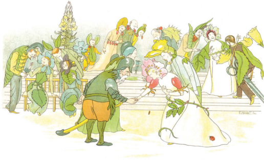
Abb. 3: Empfang der Hochzeitsgäste.

Ernst Kreidolf: Blumen-Märchen . [Nachdruck der Ausgabe Köln 1900.] Zug: Ars Edition, 2000, ohne Paginierung.