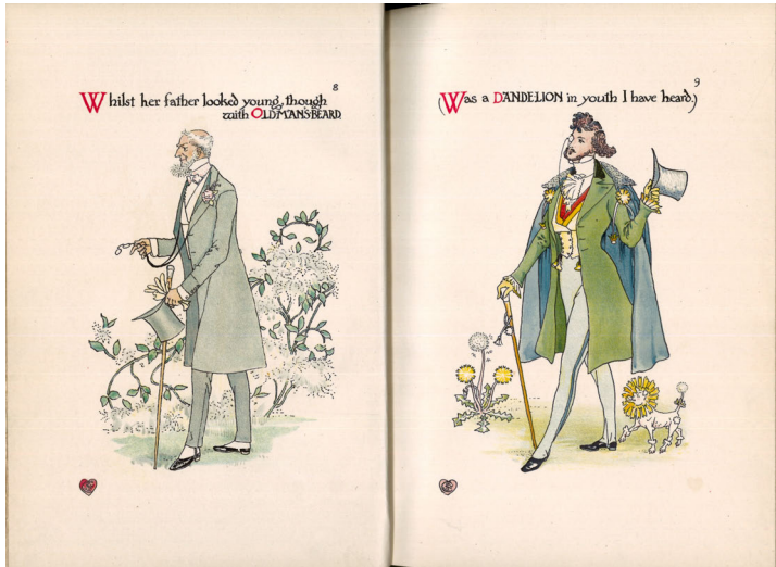
Abb. 2: Der Brautvater als Greis mit old man's beard ( clematis vitalba ) und als Dandy mit dandelion .

Walter Crane: A Flower Wedding . London: Cassell & Co., 1905, S. 8–9.