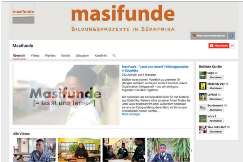
Abbildung 20: Die NPO Masifunde lässt auf ihrem YouTube-Kanal auch Begünstigte zu Wort kommen und hat ein besonders liebevolles Begrüßungsvideo ausgesucht.