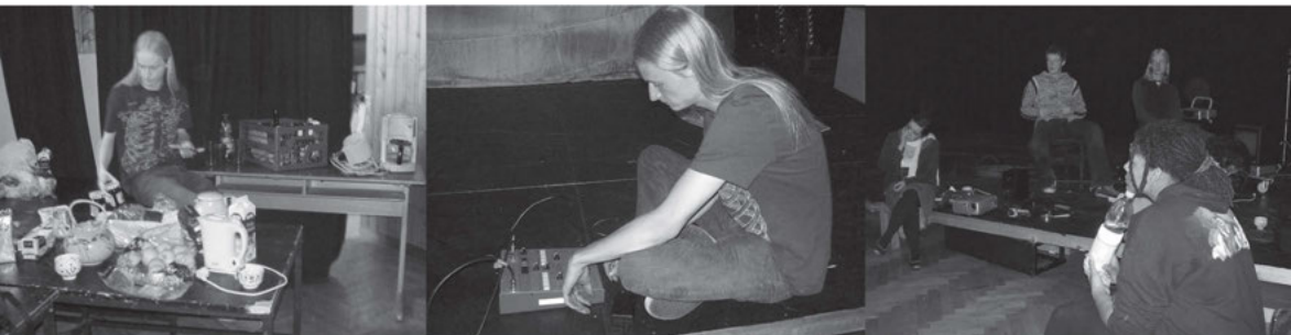
Entstehung von „Schatten“ – „Eulen“ – „Fatimas Räume“

Wir haben in beiden Projekten das Ende durch einen zeitlichen Rahmen vorgegeben und gleichzeitig dem Ganzen einen ergebnisoffenen Charakter gelassen. Von Anfang an war klar, dass vor allem das erste Projekt eine größere Öffentlichkeit bekommen sollte. Wir wollten es nicht in einem hauptsächlich von Jugendlichen frequentierten Raum, wie einer Schule oder einem Jugendzentrum, präsentieren,