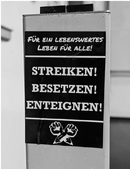
Abb. 6: UHG, Hörsaal 1.

Mit der Lesewoche besteht also bereits ein institutionalisiertes Angebot innerhalb der Universität, das Gestaltungsmöglichkeiten auch für Studierende zu bieten verheißt. Inwieweit dies auch der Wirklichkeit entspricht, galt es nun zu erkunden. Die Entscheidung, zu versuchen mein Projekt im Rahmen der Lesewoche umzusetzen, traf ich jedoch nicht zuletzt auch mit der Aussicht auf Zugang zu institutionellen Ressourcen: insbesondere eine Räumlichkeit für die Ausstellung, eine Platzierung im offiziellen Veranstaltungsprogramm der Lesewoche sowie technische Ressourcen, wie zum Beispiel einen Beamer; allesamt Elemente, die zu einer erfolgreichen Umsetzung der Ausstellung erheblich beitragen würden. Aber gerade die Verfügbarkeit eines geeigneten Raums erwartete ich als größtes mögliches Hindernis für die Realisierung meines Vorhabens. Daher zeigte ich mich bei der Einreichung meines Ausstellungskonzepts als Veranstaltungsvorschlag betont offen gegenüber Termin-