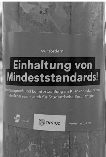
Abb. 4: Universitätsstraße.

Die praktische Umsetzung des Projekts erfolgte innerhalb eines Monats, im Mai 2023, und lief in drei Phasen ab, die sich teilweise zeitlich überschneiden: Während der Planungs-Phase in den ersten beiden Mai-Wochen arbeitete ich das Ausstellungskonzept genauer aus, organisierte einen Termin für die Realisierung der Ausstellung in der Universität und passte daraufhin die Zeitplanung für den weiteren Verlauf des Projekts an. Die Foto-Phase, in der ich den Universitätscampus nach relevanten Fotomotiven durchforstete, dauerte vom 5. bis zum 19. Mai. Die finale Ausstellungs-Phase startete ich schon am 17. Mai mit dem Beginn der Vorbereitungsarbeiten für die Ausstellung, deren Durchführung am 30. Mai den Abschluss des Projekts markierte.