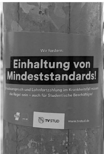
Abb. 4: Universitätsstraße.

Die praktische Umsetzung des Projekts erfolgte innerhalb eines Monats, im Mai 2023, und lief in drei Phasen ab, die sich teilweise zeitlich überschneiden: Während der Planungs-Phase in den ersten beiden Mai-Wochen arbeitete ich das Ausstellungskonzept genauer aus, organisierte einen Termin für die Realisierung der Ausstellung in der Universität und passte daraufhin die Zeitplanung für den weiteren Verlauf des Projekts an. Die Foto-Phase, in der ich den Universitätscampus nach relevanten Fotomotiven durchforstete, dauerte vom 5. bis zum 19. Mai. Die finale Ausstellungs-Phase startete ich schon am 17. Mai mit dem Beginn der Vorbereitungsarbeiten für die Ausstellung, deren Durchführung am 30. Mai den Abschluss des Projekts markierte.