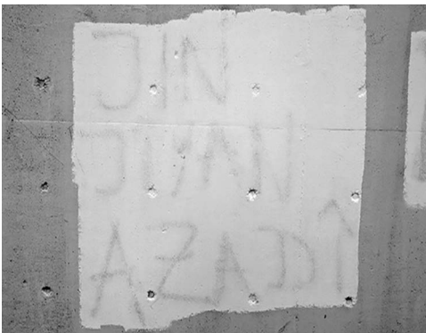
Abb. 3: Unter der Farbe erkennbares Graffiti an der Rampe neben dem Haupteingang des UHG.

Das Erstellen eines solchen Korpus an Fotografien von Graffitis und Stickern in den Gebäuden und auf dem Gelände der Universität Bielefeld beinhaltet schließlich einen dokumentarischen Aspekt. Insbesondere vor dem Hintergrund der fortschreitenden Renovierungsarbeiten am Hauptgebäude (UHG) ist absehbar, dass diese Ausdrücke des politischen Lebens an der Universität nicht ewig erhalten bleiben werden. Darüber hinaus ‚verschwinden‘ Graffitis und Sticker auch im alltäglichen Universitätsbetrieb, nicht zuletzt aufgrund von Praktiken des aktiven Entfernens oder Zerstörens. Anschaulichstes Beispiel in dieser Hinsicht ist die Brücke, die den Haupteingang des UHG mit der Stadtbahn-Haltestelle verbindet. Auf deren wandartige Geländer geschriebene (gerade auch politische) Graffitis werden regelmäßig mit Farbe überstrichen und so unkenntlich gemacht