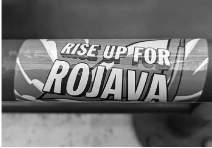
Abb. 5: UHG, Haupthalle, Galerie D1.

Platz im Studienalltag findet. Explizit verstanden als Lesewoche , soll sie Freiheiten ermöglichen, Interessen jenseits der planmäßigen Studieninhalte zu verfolgen. Außerdem können nicht nur Lehrende, sondern auch Studierende Vorschläge für Veranstaltungen machen, die dann in dieser Woche stattfinden können.