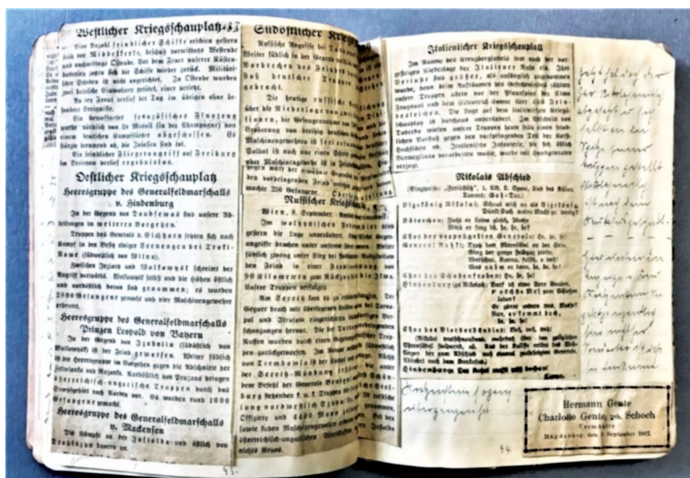
Abb. 3: Dokumentation simultaner Ereignisse im Tagebuch von Elisabeth Schatz.

Eine Grundbedingung der Moderne wird somit in eine simultane Darstellungsform überführt. 35 Die Darstellung in der Zweidimensionalität ermöglicht es, die geteilte Gegenwart dieser Ereignisse aufzuzeigen, sie zu einer mitgeteilten Gegenwart zu machen und zugleich – über die Form der Ausschnitte, die ihre Ränder offen ausstellen – als eine aufgeteilte Gegenwart auszuweisen. Gleichzeitig tritt uns besonders an diesem Tagebuch die enorme Dichte der Ereignisse vor Augen: Das Geschehen des Tages passt kaum mehr auf eine Tagebuchdoppelseite, manchmal werden Ausschnitte daher auch zusätzlich eingelegt oder ineinander geklebt, sodass aus der Montage im Tagebuch beinahe eine statistische Zusammenstellung der Kriegeereignisse ersichtlich wird. Die Dokumentation am Material vereint Stofflichkeit und Aktualität und gerinnt so zum Aufzeichnungsautomatismus.