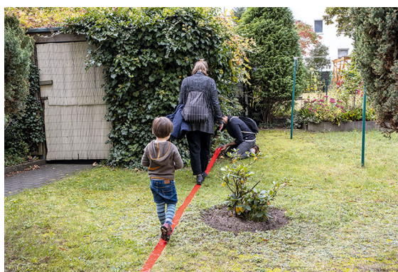
Abbildung 1: »Deutsch-Russisches Museum«