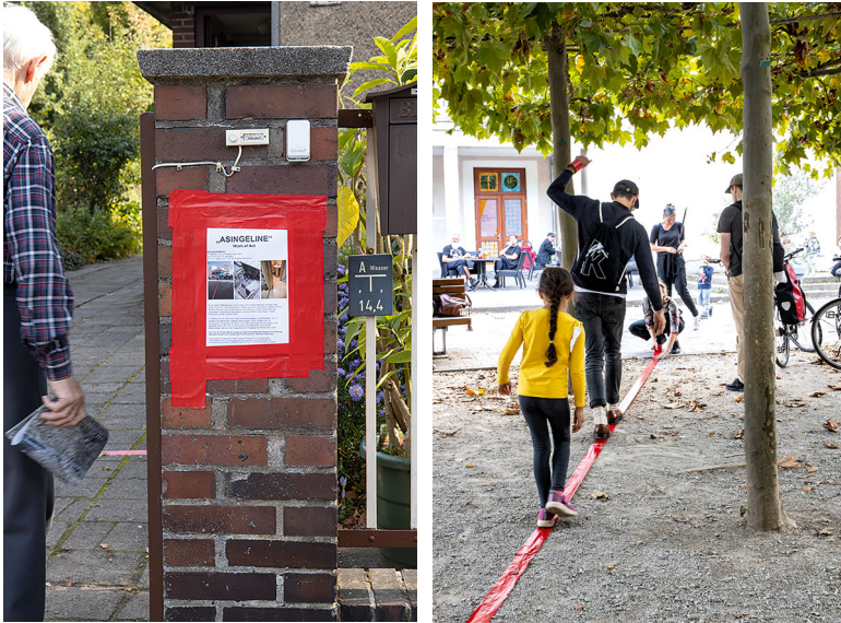
Abbildung 3: »Info an Gartentor« und Abbildung 4: »Theatervorplatz«

Deutsche*r) ist und welche Funktion(en) das Theater in aktuellen gesellschaftlichen Prozessen hat.