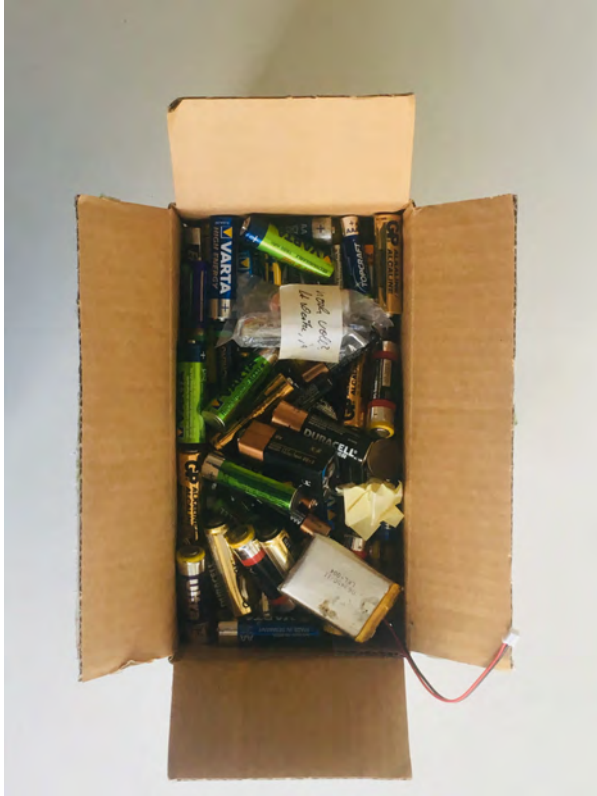
Abb. 1: Zwischenlager für leere Batterien und Akkus am Institut für Kultur und Ästhetik Digitaler Medien der Leuphana Universität Lüneburg.