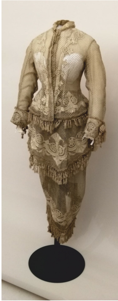
Abb. 5: Figurine mit provisorisch aufgezogenem Kleid