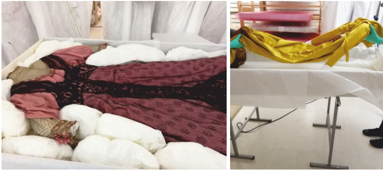
Abb. 3 u 4: Links ein geöffneter Kleiderkarton, das Herausheben der Kleidung rechts

Jedes Mal folgt nun ein besonderer Augenblick: Der Deckel des Kartons wird geöffnet und das Kleidungsstück liegt vor den Wissenschaftlerinnen. Halsausschnitt, Oberteil, Ärmel, Rockfalten sind ausgefüllt mit Seidenpapier, um eine Faltenbildung oder das Übereinanderliegen von Stoffschichten zu vermeiden. Weitere Seidenpapierstücke umrahmen das Kleidungsstück und schließen auf diese Weise Lücken im Karton – ein Verrutschen der textilen Objekte soll damit verhindert werden (vgl. Abb. 3). Schon bei diesem ersten Blick auf das noch in Papier verpackte Objekt gehen den Forschenden verschiedene Gedanken durch den Kopf. Es kann die Überraschung über die Farbintensität eines Stoffes, die Bestätigung einer erwarteten schnittechnischen Besonderheit sein oder die Vorfreude, ein Detail näher untersuchen zu können. Manchmal wird dieser Moment aber auch von Enttäuschung begleitet. Das Kleidungsstück weist keinerlei Eigenschaften auf, die man für die Untersuchungsreihe benötigt. Die aus den bruchstückhaften Datenbankinformationen zusammengesetzte Vorstellung hält der textilen Realität nicht stand.