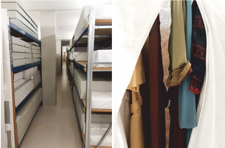
Abb. 1 u. 2: Links Regalreihen mit Kleiderkartons, rechts ein Blick auf einen geöffneten Kleiderständer

furt. Diese Arbeit war für das Projekt und die damit verbundene Ausstellung, die von Beginn an mitgedacht wurde, zentral und beruhte auf verschiedenen Vorüberlegungen. Objektbasiert zu forschen bedeutet, induktiv vor- und in diesem Fall von der Sammlung des Museums auszugehen. Dies hat erheblichen Einfluss auf das Ausstellen, da nicht ein Ausstellungsthema oder ein festgelegtes Narrativ vorgegeben ist, für das dann die ›passenden‹ Objekte gesucht würden. Vielmehr wird das Konzept aus und mit den Objekten und vom Umgang mit ihnen her entwickelt. Dieses Einlassen auf eine Sammlung und auf deren Objekte birgt nicht nur inhaltliche Potenziale, sondern auch technische (beispielsweise hinsichtlich des spezifischen Figurinenbaus) und methodische (ethnografische Zugänge). Darüber hinaus wurde überlegt, wie diese Vorgänge für die Besucher*innen erfahrbar gemacht werden könnten.