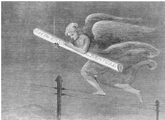
Abbildung 7: »May the Union be Perpetual«, Harper's Weekly, 1861

Diese Betrachtung erlaubt eine ganz neue politische Theorie, die nicht mehr auf die Souveränität und auch nicht mehr auf die Disziplin angewiesen ist, die den Einzelnen nicht zum Gegenstand einer