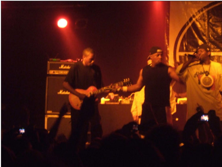
Abbildung 2: Public Enemy – Live Music Hall, Köln 6.12.2008