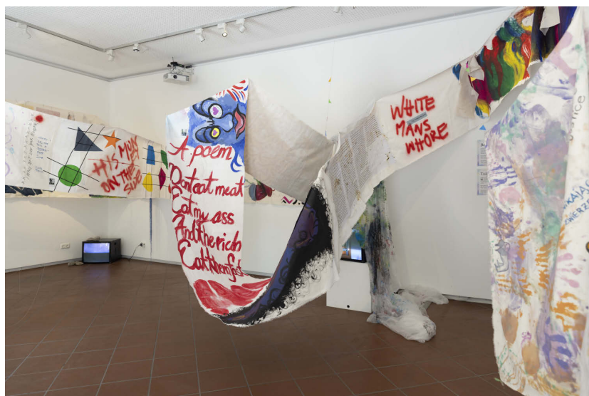
Abbildung 9: queer:raum, Kunstwerk »Wer bin ich wo?«, 2023, Münchner Stadtmuseum, Slg. Stadtkultur, Inv.nr. A-2023/247, Foto: Francesco Giordano.

Zusätzlich zu dieser Veranstaltung erarbeiteten 15 queer-migrantische Künstler*innen des Münchner Kollektivs »queer:raum« im Rahmen der Pride Weeks im Juni 2023 während einer Residency in der »Galerie Einwand« (vgl. Goeke 2024) ein kollaboratives und interdisziplinäres Kunstwerk mit dem Titel »Wer bin ich wo?«. An mehreren Abenden lud das Kollektiv zudem verschiedene queere Vereine und Gruppen aus München ein, um sich in Lesungen, Auftritten, Talks und Workshops intersektional mit queeren Identitäten, Migrationsbiografien sowie prekären Bedingungen für die Kunst in München auseinanderzusetzen. Der zehntägigen Werkphase, in der die Galerie zu einem offenen Atelier umfunktioniert und das Kunstwerk erschaffen wurde, folgte ein dreiwöchiger Ausstellungszeitraum, in welchem der Öffentlichkeit das Ergebnis der Arbeit präsentiert wurde, die sich mit queerem Leben aus einer postmigrantischen Perspektive auseinandersetzte (Abb. 9). Anschließend ging das Kunstwerk als Ankauf in die Sammlung des Münchner Stadtmuseums über. Auch bei diesem Projekt wurde versucht, sich als Institution in der Zusammenarbeit möglichst zurückzunehmen und lediglich als Raumgeber zu dienen. Die konkrete Ausgestaltung und Planung wurde dem Künstler*innen-Kollektiv überlassen.