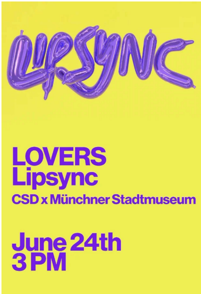
Abbildung 7: Akın Akkuş, Plakat »LOVERS Lipsync CSD x Münchner Stadtmuseum«, 2023.