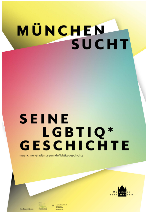
Abbildung 4: Titelbild des aktualisierten Flyers zum Sammlungsprojekt »München sucht seine LGBTIQ*-Geschichte«, 2024, Münchner Stadtmuseum.

Im Münchner Stadtmuseum war der Aufruf Grundlage und Startschuss, um die eigenen Sammlungslücken zu schließen, das Thema hausintern dauerhaft zu etablieren und den Austausch mit Einzelpersonen sowie Vereinen und Verbänden aus der Münchner LGBTIQ*-Communitys zu verstetigen. In den fünf Jahren seit Beginn des Aufrufes konnten so insgesamt rund 1.000 Objekte in die Sammlung übernommen werden, die in der Museumsdatenbank des Münchner Stadtmuseums mit dem Schlagwort »LGBTIQ*« auch klar als queere Objekte verzeichnet sind. Es gelangten persönliche Erinnerungsstücke und Alltagsgegenstände wie Fotografien, Video- und Tonaufnahmen, Drucksachen, Transparente, Tagebücher, Kleidungsstücke sowie weitere Objekte in die Sammlung. Diese Objekte stellen das Leben von queeren Münchner*innen und das Wirken der LGBTIQ*-Communitys