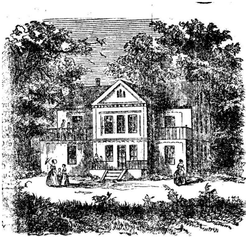
Abb. 7: Lehr- und Erziehungsanstalt Van Demergel im d'Orsaypalast in Erdberg.