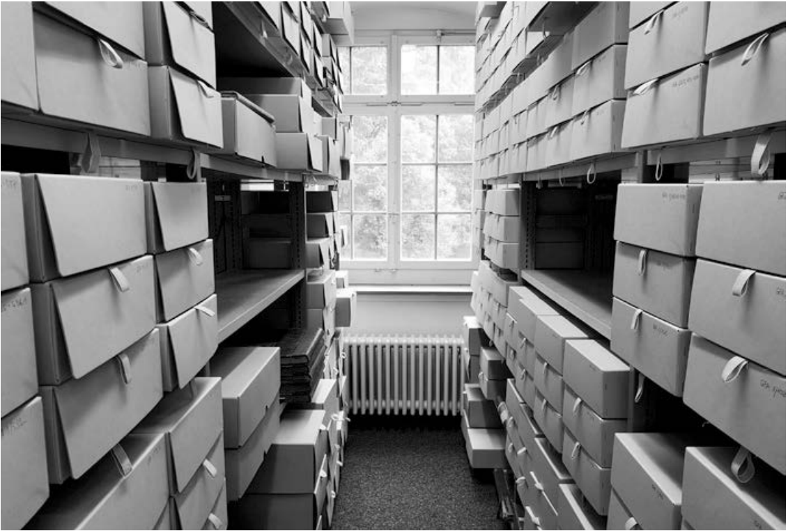
Abb. 1 Blick in Regale des Konzernarchivs der Georg Fischer AG Schaffhausen, Juni 2019, Arbeitsplatz einer unserer Gesprächspartnerinnen