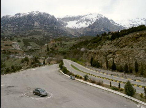
Autonomous Trap 001, James Bridle, 2017