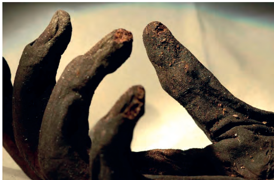
[ 4 ] Nahaufnahme der Hand von Moora, der in den Jahren 2000 und 2005 im Großen Moor bei Uchte in Niedersachsen gefundenen Moorleiche eines Mädchens aus der Vorrömischen Eisenzeit.