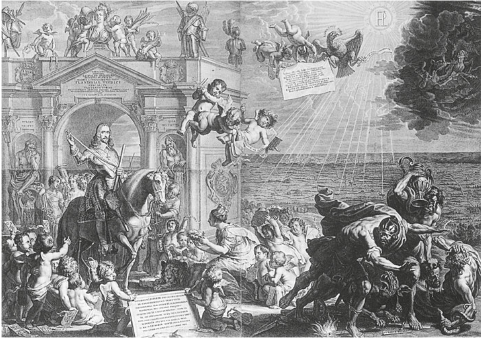
Abb. 21: Schelte a Bolswert (nach Erasmus Quellinus), Flandria liberata , Kupferstich, 1653, Gent, Stadtarchiv.

des Erzherzogs zu betonen. In Brüssel begann Leopold Wilhelm zugleich den Aufbau seiner Kunstsammlung, deren Ausbau später sein politisches Geschick überstrahlen sollte.