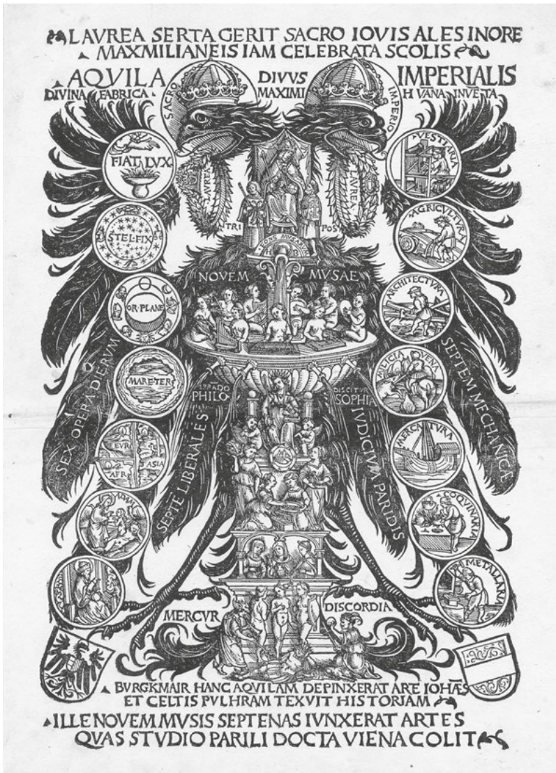
Abb. 13: Hans Burgkmair d. Ä., Der allegorische Reichsadler des Konrad Celtis , Holzschnitt, um 1507, Wien, Albertina, Inv.-Nr. DG1934/149.

beide für Kunst, Wissenschaft und Taten für das Gemeinwohl Neigung und Befähigung hätten – so Conrad Peutinger, der Maximilian und Herkules somit in eine somatisch-dynastische Beziehung zueinander setzt. 17 Celtis hingegen argu-