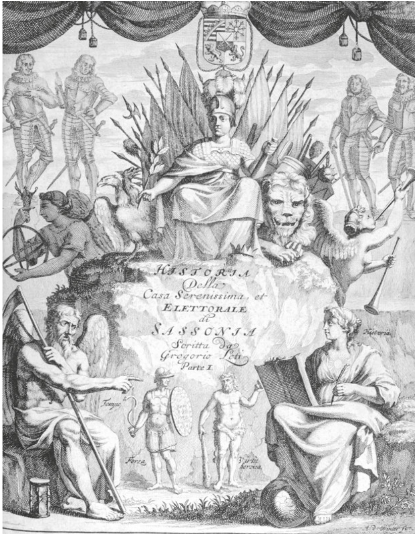
Abb. 24: Gregorio Leti, Titelblatt Ritratti Historici, Politici, Chronologici e Genealogici, Della Casa Serenissima & Elettoriale di Sassonia , Bd. 1 Amsterdam 1688.

s'aggira nel Petto, vera Fucina di Grazie dell'A. V. S. più risplendente di quella che si è mai visto nel cuore di qualsisia Gran Monarca. 110