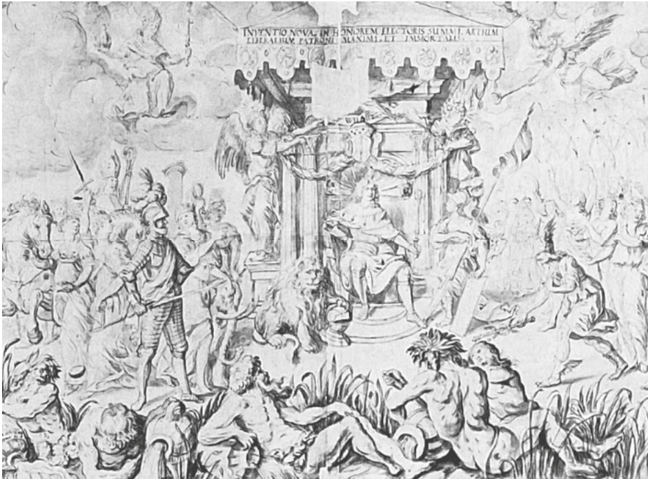
Abb. 27: Christian Schiebling, Inventio zu einer Allegorie auf Friedrich Wilhelm , Federzeichnung, 1652, Berlin, Staatliche Museen, Kupferstichkabinett.

ebenfalls alludiert, wenn von links Leuchter und Schalen von römischen Soldaten und Sklaven gebracht werden. Der Kurfürst ist in dem Relief präsent, das die Personifikation der Bildhauerei mit der Inschrift „HERCVLI MVSAR[UM]“ vollendet. Seine ruhmvolle Memoria wird damit ebenso in die Überzeitlichkeit erhoben wie die antiken Kunstwerke Zeugen ihrer Vergangenheit sind und durch weitere Medien – repräsentiert durch den alten Mann rechts am Bildrand mit Buch und Medaille – bewahrt werden.