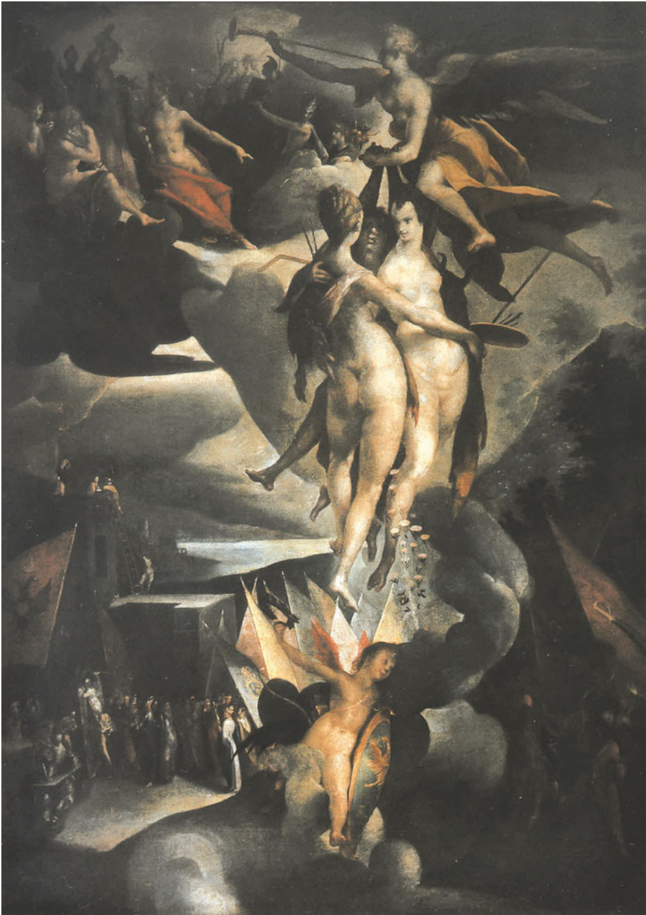
Abb. 17: Bartholomäus Spranger, Fama führt die Künste in den Olymp , Öl auf Leinwand, um 1596, Prag, Nationalgalerie.