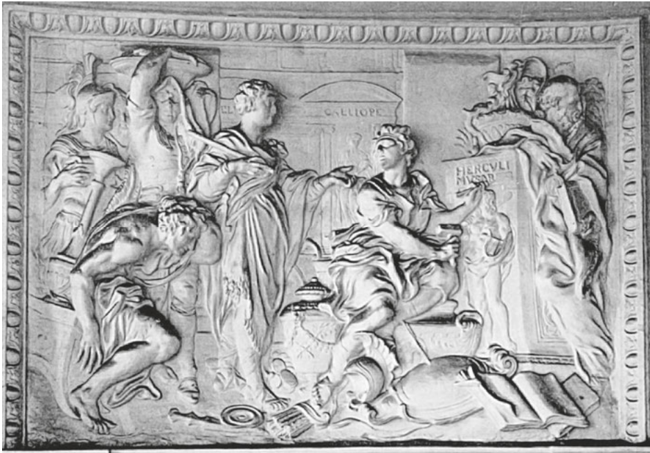
Abb. 26: Johann Friedrich Eosander von Göthe, Der Imperator läßt Trophäen in einen Musentempel einbringen (Allegorie auf die Förderung der Schönen Künste), Relief im oberen Saal, um 1710, Berlin, Schloss Charlottenburg.

Im erhaltenen Skizzenbuch von Christoph Pitzler ist auch die Decke des Alabastersaales beschrieben, die Rahmungen in den Vouten nehmen noch einmal direkten Bezug zur engen Verbindung des Kurfürsten als Kriegsherr und Musenfürst, denn es waren gezeigt „die Künste als Arch(itettura) mit Pozdam, Pittura mit des Churfürsten) und contref(ait) des alten, Fortif(icatione) mit Berlin, Scultura mit des Churfürsten) contref(ait) des alten“. 118