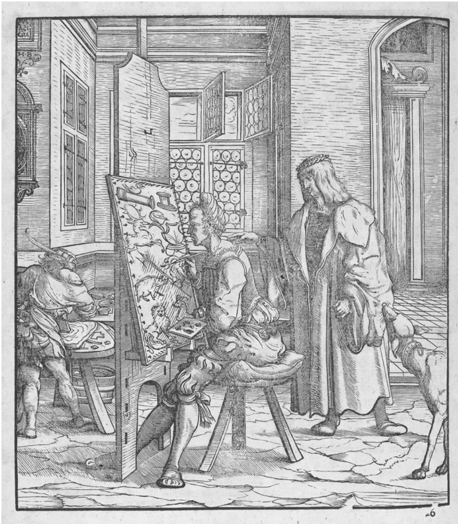
Abb. 15: Hans Burgkmair, Maximilian I. als Alexander d. Gr. in der Werkstatt des Apelles , Holzschnitt/Kupferstich (1516), Titelblatt, Faksimiledruck in Marx Treitzsauerweins Der Weißkunig , Wien 1775.

Dieses Motiv wird nicht mehr aufgenommen, stattdessen wird im übrigen Teil des Buches über sämtliche Schlachten, Kriege und militärischen Erfolge des Weißkunig berichtet. Nimmt man jedoch die anfängliche Behauptung ernst, die Grundlage dafür liege in der Kunstausbübung bzw. -kenntnis, dann kommt ihr eine eminente Rolle im Staate zu, die sich in den herausragenden Taten des Weißkunig manifestiert. In der ‚hagiographischen Biographie‘ des Weißkunig wird zudem berichtet, dass Maximilian auch die Malerei, die Steinbaukunst und das