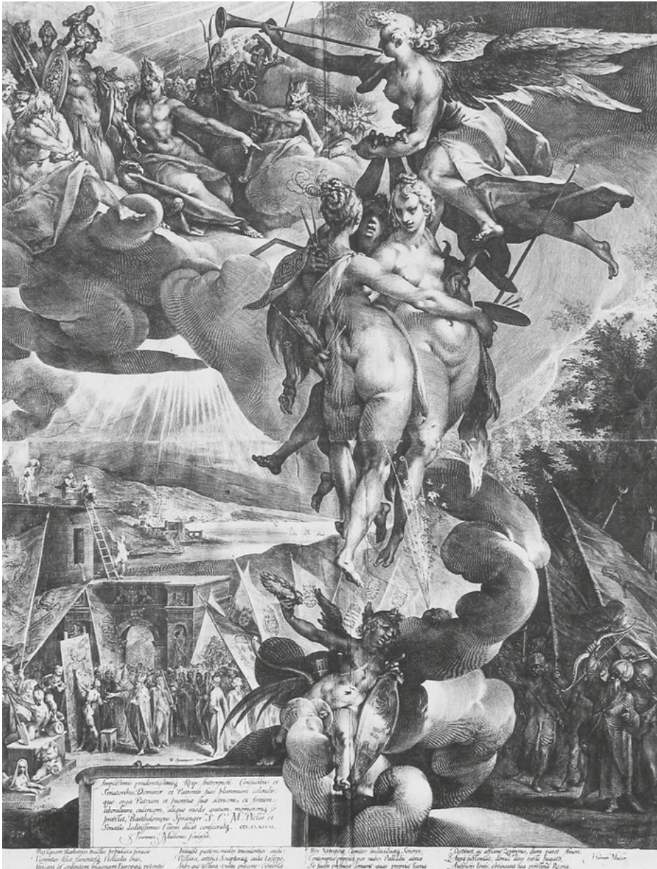
Abb. 18: Jan Harmensz Muller, Fama führt die Künste in den Olymp (Allegorie der Künste), Kupferstich, 1597, Amsterdam, Rijksmuseum.

Rand hingewiesen (Abb. 18). Dieser Stich von 1597 deutet auf die Dominanz des herrscherlichen Images als Türkenbezwinger, damit Friedensbringer und Kunstförderer, das weite Verbreitung finden sollte. Hinter dem im linken Bildhintergrund noch tätigen Maler haben sich geistliche und weltliche Würdenträger als