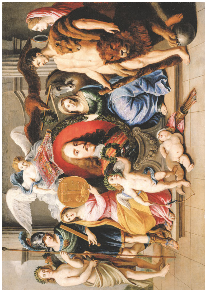
Abb. 23: Jan van den Hoecke, Allegorie auf Erzherzog Leopold Wilhelm als Patron der Künste , Öl auf Leinwand, um 1650, Wien, Kunsthistorisches Museum, Inv.-Nr. GG_9682.