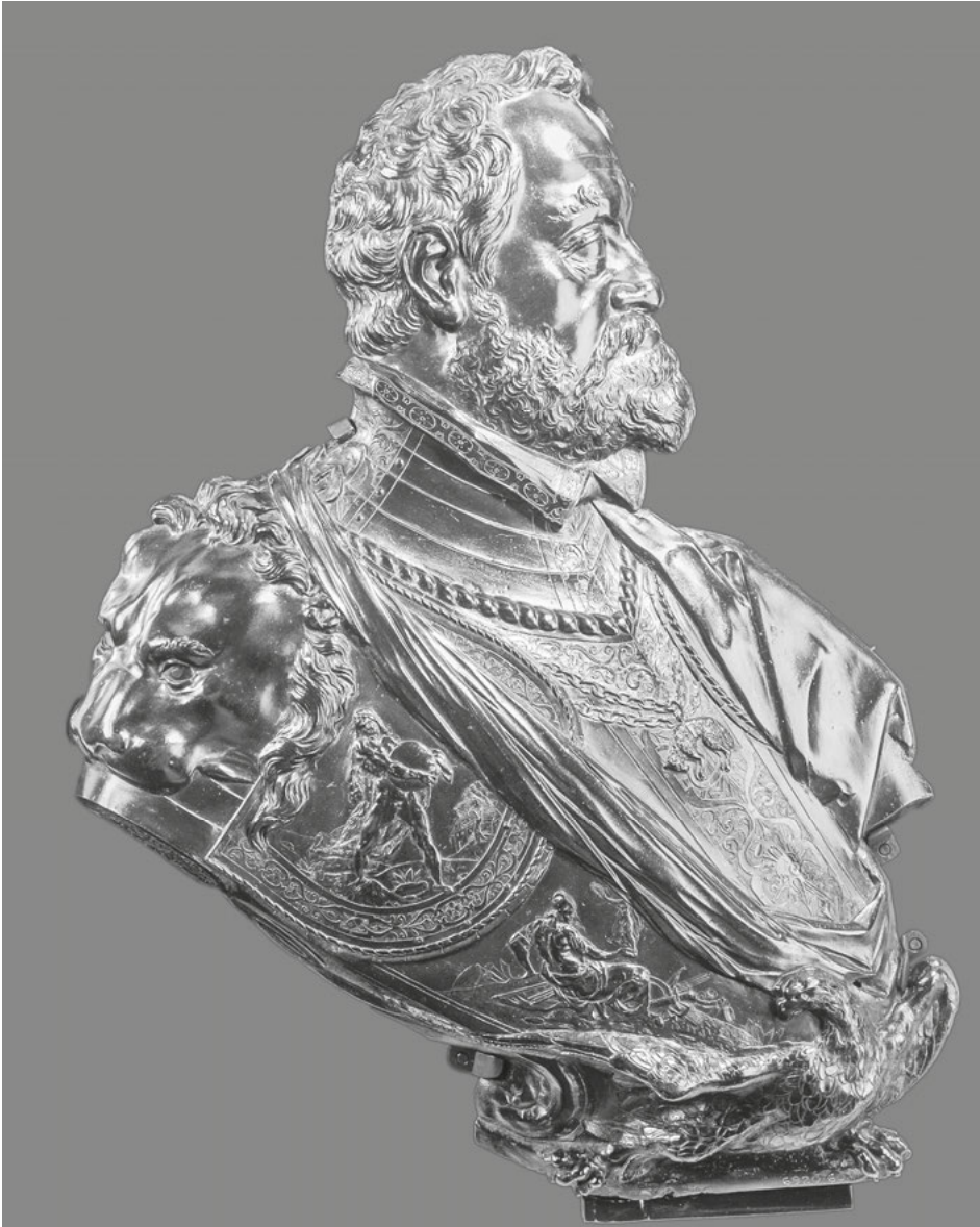
Abb. 16: Adriaen de Vries, Rudolf II. , Bronze, 1609, London, Victoria and Albert Museum.

gründung formal-äußerlich vermitteln kann. Unterhalb der Herkules-Szene ist eine Minerva mit einer Viktoria-Statuette auf Waffen ruhend in den Harnisch getrieben, wodurch die inhaltliche Komponente der Herkules-imitatio weiter ausgestaltet werden kann und eine Verbindung zu einem durch Stärke erlangten Frieden und dem Träger der Rüstung als Schutzherrn der Künste geschlagen wird.