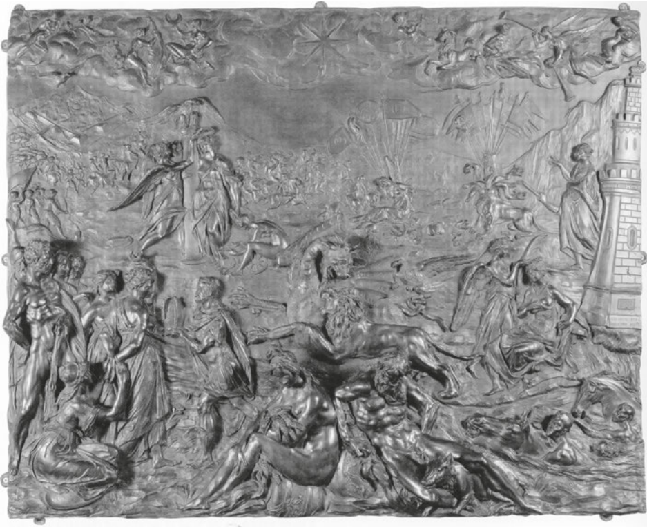
Abb. 20: Adriaen de Vries, Rudolf II. triumphiert über die Türken , Bronzerelief, um 1603, Wien, Kunsthistorisches Museum, Kunstkammer, Inv.-Nr. 5474.

ihm folgen. 53 Der Malerei überreicht er ein Geschenk, während er mit seinem Pferd den Neid zertritt. Diese Handlung wird im Hintergrund rechts gespiegelt durch Herkules, der einen Satyr mit erhobener Keule festhält. Im Hintergrund ist ein Rundtempel mit Minerva auszumachen. An den Rändern im Vordergrund sind ein Flussgott mit Löwe (als Personifikation der Moldau mit dem Wappentier des Königreichs Böhmen) und eine Fama als Liege- bzw. Sitzfigur gezeigt. Adler und Capricorn erscheinen als Verweise auf Augustus. Mit dem Pendant des Reliefs, einer Allegorie auf den Türkenkrieg in Ungarn (Abb. 20), 54 das die kriegesischen Leistungen Rudolfs glorifiziert, erscheint Rudolf in diesen Kunstwerken in der Verbindung von siegreichem Retter der Christenheit und Förderer der Künste und Wissenschaften. 55 Die Einheit der Kunstwerke symbolisiert die Zusammengehörigkeit von arma et litterae bzw. Arte et Marte . Die Pendants machen ebenfalls