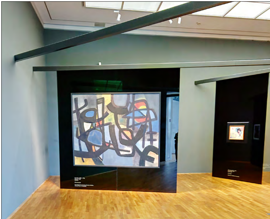
Abb. 2: Ausstellungsraum »Maler der inneren Emigration« mit einer Arbeit von Fritz Winter (vorn) und Fritz Levedag (rechts hinten).

Innerhalb des Ausstellungsraums begegnet man den Arbeiten von Fritz Winter durch die Hängung als Solitär auf einer Trennwand als Einzelwerke und zugleich als Œuvre, wie man auch in der Zusammenschau mit Zeitgenossen Winter als Vertreter einer bestimmten Kunstrichtung und Kunstepoche begegnet (Abb. 2). Allerdings belässt es der Ausstellungsraum nicht bei einer konventionellen, eher auratisierenden Hängung im Sinne des neutralisierenden White Cube (den es auch mit grauen Wänden geben kann). Die kontextualisierende unruhige, unklare Szenografie mit unüberschaubaren Laufwegen und mit irritierenden Spiegelungen der Besucher:innen der Gegenwart in den Wänden, vor denen die Bilder der Vergangenheit hängen, konfrontiert nicht mit zeit-