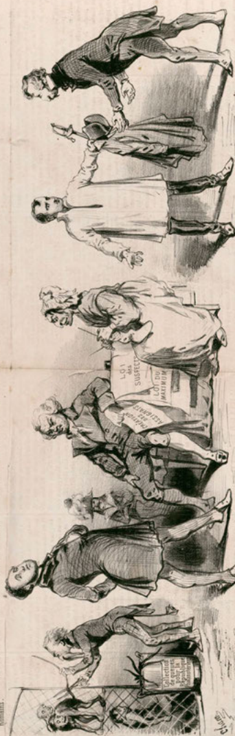
Abb. 13: Cham: Ce qu'on appelle des idées nouvelles en 1848, Paris 1848. Collection de Vinck, 14121.