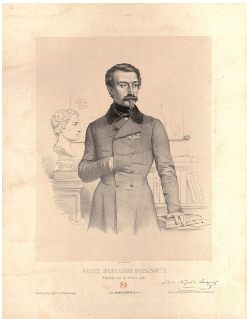
Abb. 12: Marie-Alexandre Alophe: Louis Napoléon Bonaparte, Représentant du Peuple (Seine), Paris 1848. Collection de Vinck, 14953.