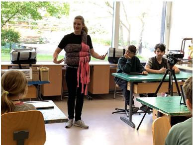
Abbildung 31: Irritierender Einstieg ins dialogisch ästhetisch-forschende Lernen.