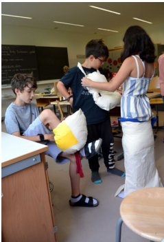
Abbildung 42: Anprobe für die bevorstehende Modeschau.