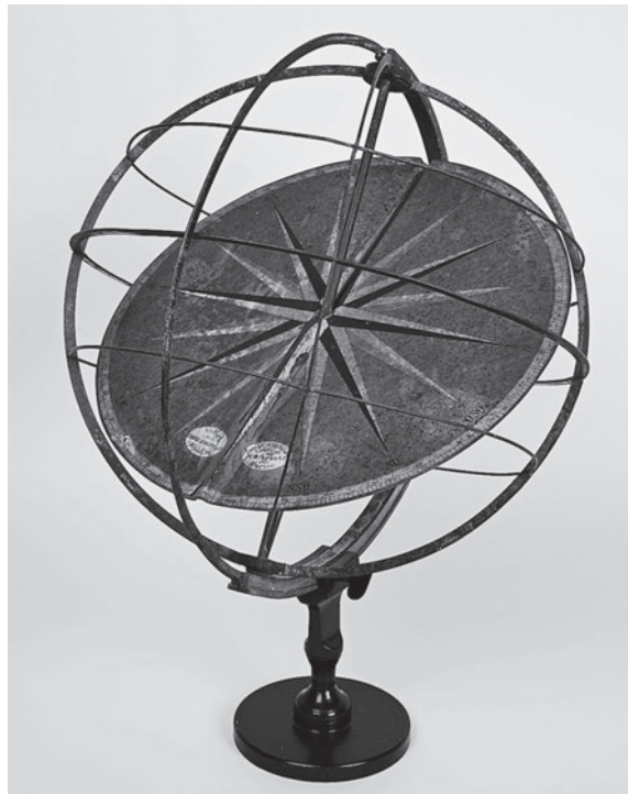
Abb. 4: Der überaus seltene sog. Diesterwegsche astronomische Tisch von 1894 in der SB Berlin, Kartenabteilung