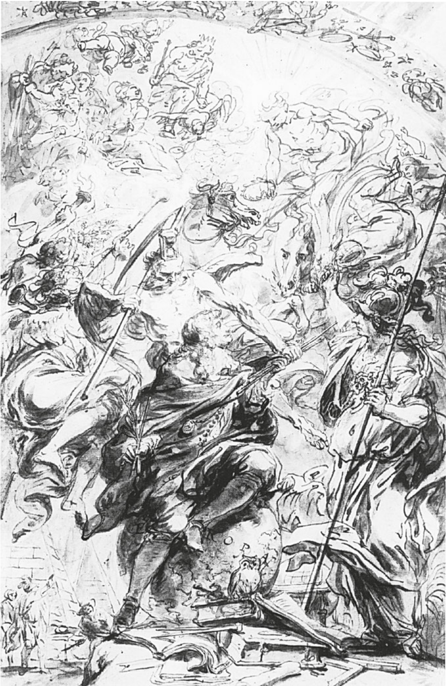
Abb. 70: Michael Willmann, Allegorische Huldigung Joachim von Saurarts , Federzeichnung, 1682, Wien, Grafische Sammlung Albertina.