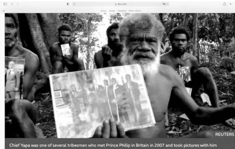
Abb. 3 BBC News, 12.4.2021, Screenshot

Objekte, also selbst als <Cargo> zu betrachten, dessen Besitz Wissen und damit auch Macht innerhalb der eigenen Gruppe und gegenüber (post-)kolonialen Autoritäten verspricht. 23 Denn mit dem Besitz von Fotografien bemächtigen sich die Leute von Tanna zugleich einer westlichen Bildpraktik.