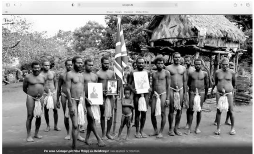
Abb. 1 Spiegel Online, 13.4.2021, Screenshot

Zeitvorstellungen aufeinandertreffen: die Dauer der Kolonialisierung der Insel, die 1774 mit der Landung von James Cook begann und 1980 mit der Unabhängigkeit des Inselstaates Vanuatu ein offizielles Ende fand, und die mythische Zeit(-losigkeit) der Nähe oder Ferne, An- oder Abwesenheit der Ahn_innen. 5