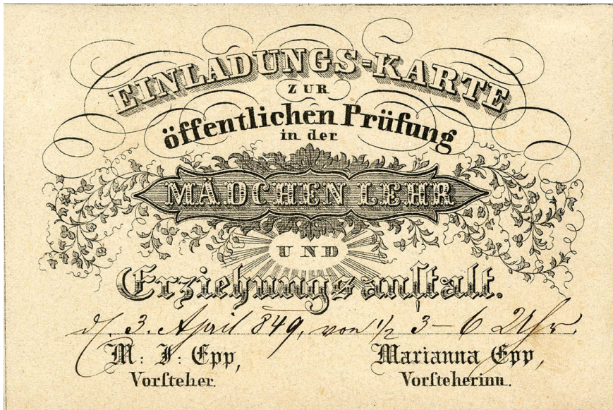
Abb. 8: Einladung zur öffentlichen Prüfung am Institut Epp.