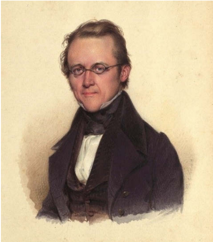
Abb. 10: Carl von Saar, Eduard von Bauernfeld (1802–1890) um 1830.