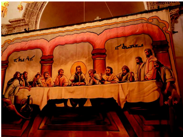
Bild 8: Syrisch-orthodoxe Ikonostase als Vorhang vor dem Altarraum

und enthüllt dann erst den Altarraum. Das obenstehende Foto aus dem christlichen Kloster Mor Gabriel in Südostanatolien ist ein historisches Dokument, denn im Juni 2016 enteignete die türkische Regierung alle christlichen Klöster und konfiszierte ihr Inventar.