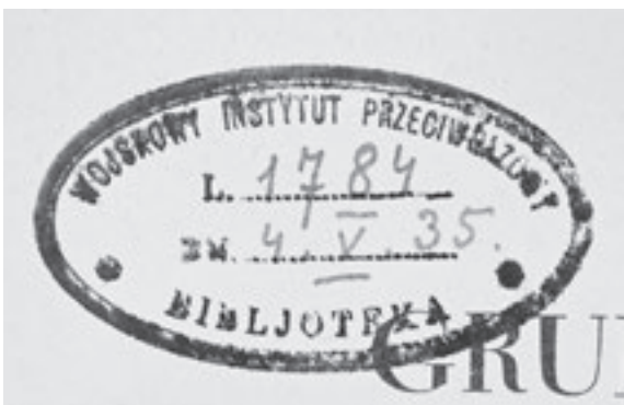
Abb. 6: Wojskowy Instytut Przewodnictwa i Inżynierii Wojskowej i Inżynierii Lotniczej (Warschau), Bibliothek. Besitz- und Zugangsstempel in: Herbert Herxheimer, Grundriß der Sportmedizin für Ärzte und Studierende. Leipzig: Thieme 1933. Aus ›Spandau‹ (vermutlich aus den Heeresgasschutz-Laboratorien) in die Universitätsbibliothek der TU Berlin eingegangen. Universitätsbibliothek TU Berlin, Sign.: 4B922

Bei der Suche nach dem Bestand ›Luftkriegsakademie Berlin-Gatow‹ im heutigen Bestand der Universitätsbibliothek der TU Berlin stießen die Projektmitarbeiterinnen auf Raubgut, das nicht zu diesem Bestand ›Luftkriegsakademie Berlin-Gatow‹ gehört. Dies betrifft die englisch-, italienisch- und deutschsprachigen Zeitschriften aus dem Wojskowy Instytut Przewodnictwa i Inżynierii Wojskowej i Inżynierii Lotniczej und anderen polnischen Militäreinrichtungen, die mit großer Wahrscheinlichkeit während des Zweiten Weltkriegs in Polen geraubt wurden. Auch sie wurden von deutschen Dienststellen offenbar zielgerichtet beansprucht und verteilt. Die Zugangsbücher verzeichnen u. a. ›Spandau‹ als Lieferanten. In der Spandauer Zitatele befanden sich bis zum Kriegsende die mit dem Heereswaffenamt verbundenen Heeresgasschutz-Laboratorien.