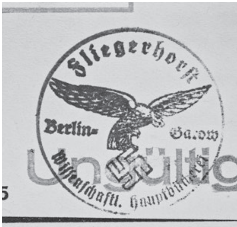
Abb. 1: Fliegerhorst Berlin-Gatow. Wissenschaftliche Hauptbücherei. Besitzstempel. Universitätsbibliothek TU Berlin, Sign.: 8B1561-5

Während zuvor die Luftkriegsakademie und die Lufttechnische Akademie, einschließlich der Institute, gleichrangig waren, so änderte sich dies 1938. Alle Neuzugänge wurden nunmehr mit einer einheitlich gestalteten Buchmarke gestempelt, die entweder nur die Bezeichnung ›Bücherei der Luftkriegsakademie‹ oder zusätzlich noch die Bezeichnungen der von ihr verwalteten, aber von verschiedenen Trägern finanzierten Teilbestände, 19 wie ›Fliegerhorstkommandantur‹, ›Höhere Luftwaffenschule‹, ›Offiziersbücherei‹, ›Technische Akademie der Luftwaffe‹ und ›Beauftragter für Hochfrequenzforschung‹, aufweist.