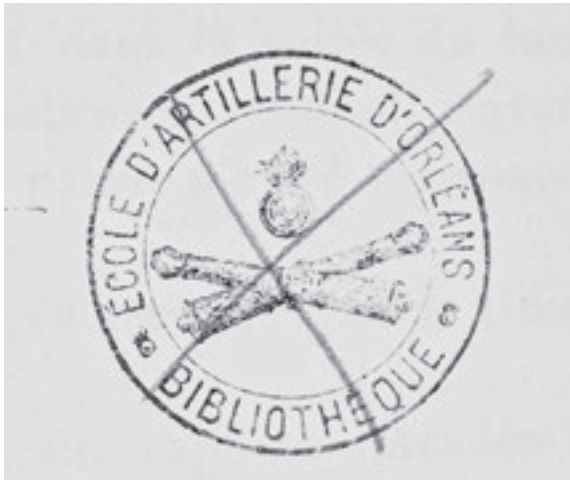
Abb. 5: École d'Artillerie Orléans, Bibliothek. Besitzstempel in Band 97 der »Comptes rendus hebdomadaires des séances de l'Académie des sciences« aus der Bibliothek der Deutschen Akademie der Luftfahrtforschung. Universitätsbibliothek TU Berlin, Sign.: 4Z462-97