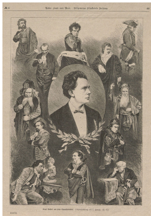
Abb. 8: Postkarte mit Rollenportraits von Ernst von Possart.

Der Darstellung einer Charakterrolle und besonders der Heldenszene kam also innerhalb des Theatermodells zurzeit Possarts die Funktion zu, zwei Besitztümer vorzuführen. Der Schauspieler sollte demgemäß die Hauptrolle besitzen und verteidigen wie ein Eigentum, und er musste den nötigen Stimmkörper besitzen, d.h. ihn bei maximaler Kraftanstrengung kontrollieren. Abweichungen, wie eine fehlerhafte Artikulation oder