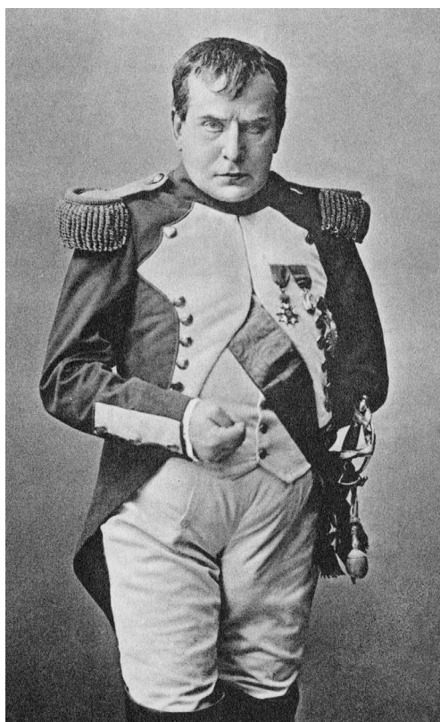
Abb. 9: Rollenportrait von Ernst von Possart als Napoleon 1909.

Das Körper sich auch spiralförmig verdrehen können, entsprach nicht der gewünschten Norm. Die aufrechte Haltung des Oberkörpers war auch beim Setzen, Greifen, (militärischen) Grüßen beizubehalten. Alles, was diesem vertikalen Szenenkreuz, als welches das Rückgrat hier figurierte, nicht entsprach, musste nach Possart »linkisch« erscheinen und eignete sich nur zur Darstellung von Tölpeln und Bauern.