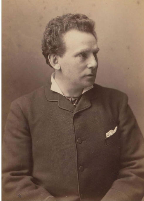
Abb. 7: Ernst Possart als junger Mann.

Die Agonie und der Kontrollverlust des Körpers inszenierte Possart in seiner autobiografischen Rückschau immer in Relation zum vermeintlich schöneren, gewandteren und mächtigeren Körper eines Anderen. Es war ein machtpolitisches Gefälle, das hier gleichsam den Raum zwischen Himmel und Erde umspannte und damit ein ästhetisches Gefälle zwischen Vorbild und Selbstbild verband. Deshalb kam es wohl zur wiederkehrenden Überprüfung der angenommenen Inkongruenz des eigenen Körperbilds im Spiegel und im Blick des Anderen. Ganz explizit wird dieses ›Spiegelstadium‹, als Possart, angestachelt durch seine erste Begegnung mit einem Schauspieler, seinen Blick auf ein Foto seiner selbst richtete, welches ihn als Kind im Sonntagsanzug zeigte. Er beschrieb den Anblick den das Foto bot.