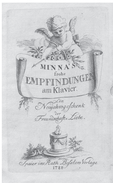
1 Minna's frohe Empfindungen am Klavier. Ein Neujahrsgeschenk der Freundschaft und Liebe. Speyer 1788, Neuerwerbung der BSB München