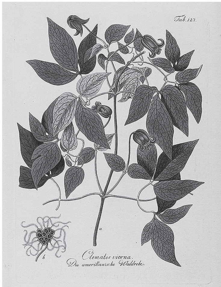
3 Franz Johann Schultz: Abbildung der inn- und ausländischen Bäume [...] , welche in Österreich fortkommen. Wien 1792–1804, aus dem Zugang der SUB Göttingen