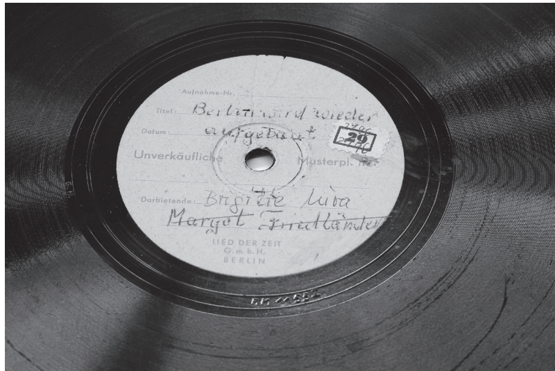
6 Schellackplatte des ostdeutschen Musikverlags »Lied der Zeit«, wahrscheinlich aus dem Jahre 1949, Neuerwerbung der DNB