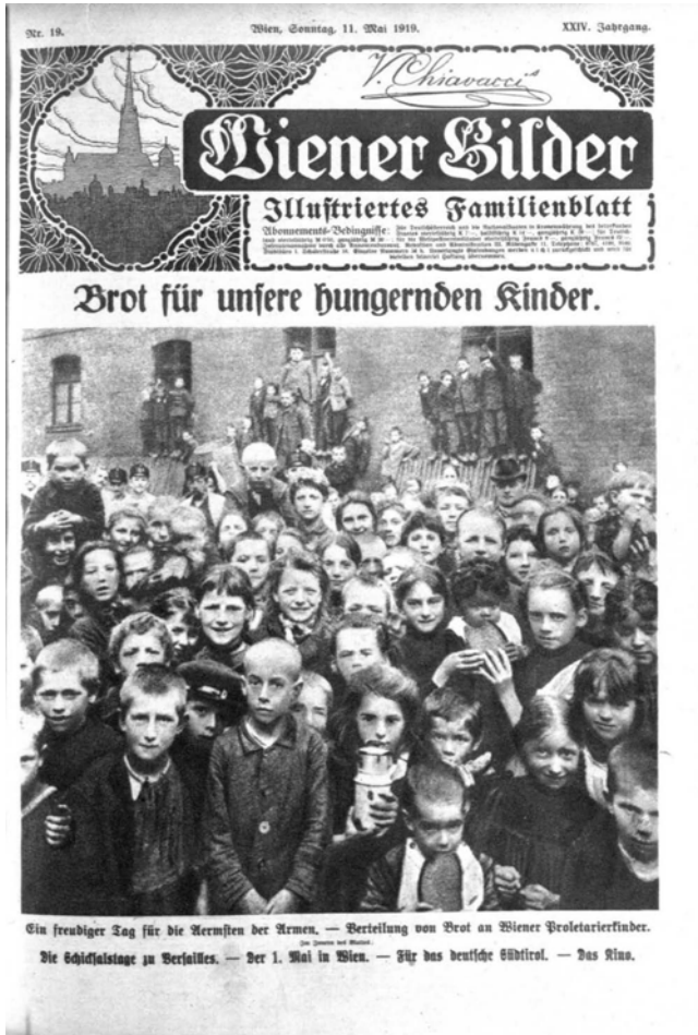
Abbildung aus Wiener Bilder 19, 11. Mai 1919.