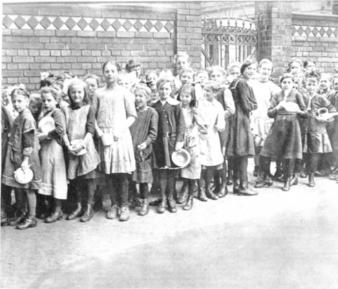
Abbildung aus Wiener Bilder 17, 25. April 1920, Titelseite.

Neben den amerikanischen, schwedischen und norwegischen Küchen, die sich ausschließlich an Kinder und Jugendliche richteten, gab es auch eine Reihe von Verpflegungsangeboten für Erwachsene. So startete Ende März 1921 eine Hilfsaktion amerikanischer Studierender für mittellose Wiener Hochschüler. Mit der Unterstützung der ARA finanzierte die »Studenten-Hilfsaktion« Mittagstische für mehr als 8.700 Studenten. 373 Eine andere Massenverpflegungsinitiative, die sich an akademische Lehrkräfte richtete, brachte der amerikanische Rochester Patriotic and Community Fund auf den Weg. 374 Dieser