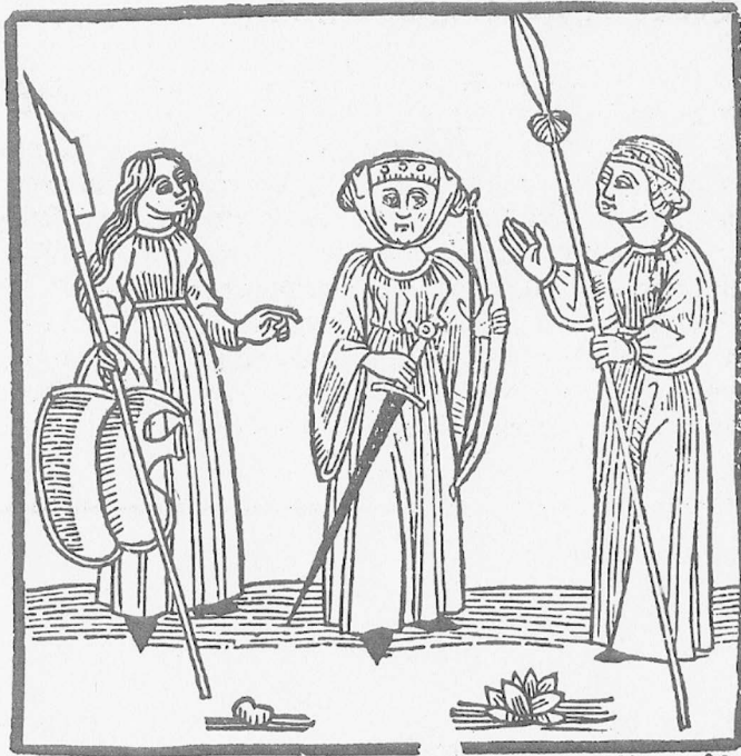
Abb. 2: Amazonen in Johannes' de Mandeville Itinerarium deutsch in der Übersetzung des Otto von Diemeringen .

Universitätsbibliothek Basel, Aleph D III 13:1, S. 107.