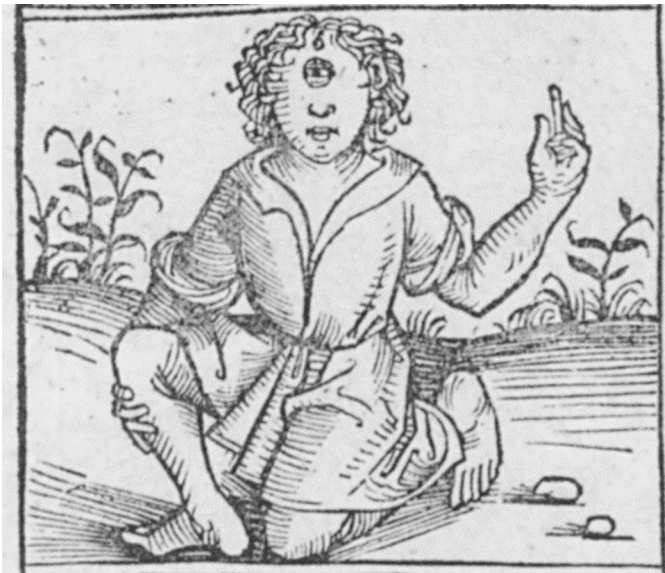
Abb. 1: Einäugiger in Hartmann Schedels Weltchronik von 1493, fol. 12r.