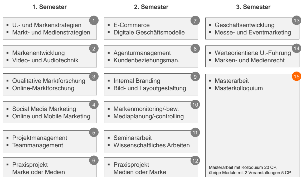
Abb. 3: Module und Studienverlauf

Dabei gilt: Jahrgangsübergreifendes Netzwerken wird in M3ve großgeschrieben. Im Winter organisieren Alumni jedes Jahr eine Skiausfahrt. Für 2019 ist zudem erstmals ein