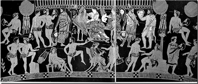
Abbildung 14: Apulischer Volutenkrater (Pronomosvase). Pronomos-Maler. Detail. Museo Archeologico Nazionale di Napoli 3240. Um 400 v. Chr. Aus: Taplin, Oliver/Wyles, Rosie (Hg.): The Pronomos Vase and its Context . Oxford: Oxford University Press 2010, S. XVf. (Inlay).

Diese Verknüpfungen von Satyrspiel und Tragödie sowie von Mythos und Theatralität, die das Artefakt der Vase zum Vorschein bringt, manifestieren sich in Schnee Weiß mittels der intertextuellen Verwebung eines spezifischen Satyrspiels (nämlich Die Satyrn als Spürhunde ) und der Bakchen -Tragödie des Euripides. Wenn nun ausgerechnet die Bakchen zitiert werden, dann ruft Jelineks Theater text dadurch einmal mehr den Dionysoskult in Erinnerung, der für die Rezeption der Pronomosvase und für das Verständnis des Satyrspiels so zentral ist. In den Bakchen fungiert dieser Kult um den Theatergott als Motor der tragischen Erfahrung und lässt dabei das immense Gewaltpotenzial erfahrbar werden, das der antiken Diskursform der Tragödie grundsätzlich inne ist. Und doch ist die Ästhetik der Gewalt, die Euripides in den Bakchen entwirft, in ihrer Drastik und in ihrem grenzüberschreitenden Potenzial beispiellos in der griechischen Tragödie: Wenn Agaue in der finalen Szene mit dem Kopf ihres eigenen Sohnes erscheint, dann vollzieht sie dadurch die Tatbestände Kindsmord, Kannibalismus und Menschenopfer und ruft mithin drei Tabus auf, die im Laufe der Zeit nichts von ihrer Gültigkeit verloren haben. Interessant daran ist aber nicht ausschließlich, was hier gezeigt wird, sondern vielmehr wie dies geschieht. Eine genauere Beobachtung dessen nämlich lässt uns die Bakchen -Tragödie als Vorläuferin einer posttraumatischen Ästhetik lesen, die in Jelineks Fortschreibung so deutlich zutage tritt.