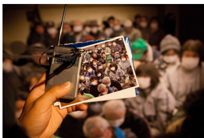
Abbildung 8: Elfriede Jelinek: Kein Licht. Epilog? Regie: Akira Takayama. Festival/Tokyo 2012.