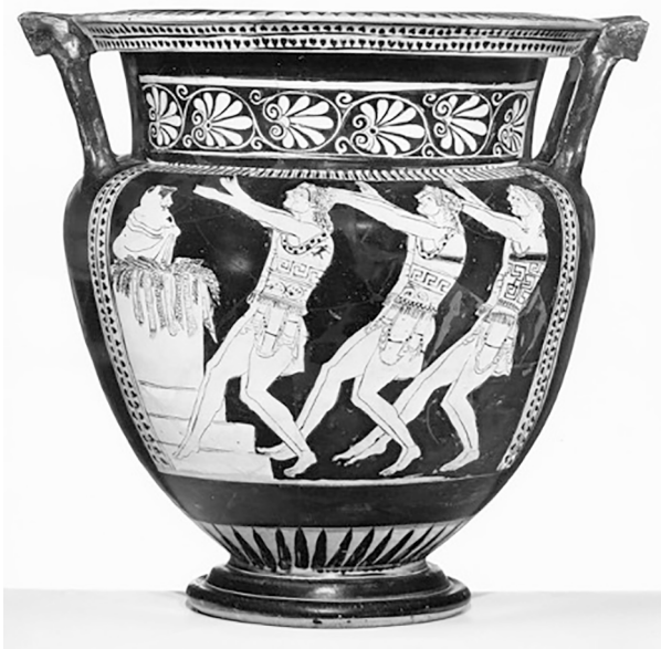
Abbildung 16: Rotfiguriger Kolonnenkrater. Antikensammlung Basel BS415. 490–480 v. Chr.

nen wie Oliver Taplin der Tragödie kategorisch absprechen, nicht schon immer und nicht ausschließlich eine Eigenart der Komödie war. 32