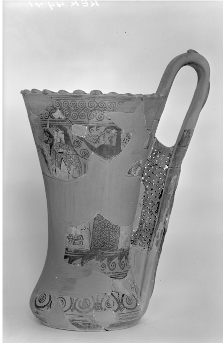
Abbildung 4: Prothesis. Becher Athen. 1280. 2. Viertel 7. Jh v. Chr. Inv. 1280 Kerameikos, Foto © Deutsches Archäologisches Institut Athen (D-DAI-ATH-Kerameikos-04941), Fotograf: unbekannt.

Das doing difference , das wir bereits auf den Vasenbildern des Spätgeometrischen ausmachen können, setzt sich in Klagedarstellungen der darauffolgenden Stilepochen fort. In der Mitte des 7. Jahrhunderts v. Chr. jedoch kommt es zu einem entscheidenden gestisch-affektiven shift. Die Klagenden strecken nunmehr einen Arm aus, während sie den anderen Arm auf Ohrhöhe zur Wange führen. Die gekrümmten Finger suggerieren dabei eine Bewegung, die keinen Zweifel zulässt: Diese klagenden Frauen zerkratzten ihr Gesicht mit den eigenen Fingernägeln. Trauer wird nun mithin als hochemotionaler, menschlicher Affekt erlebbar. 27