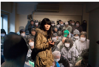
Abbildung 10: Elfriede Jelinek: Kein Licht. Epilog? Regie: Akira Takayama. Festival/Tokyo 2012.

Welche Überlegungen hatten die Auswahl dieser Bilder geleitet? Regisseur Akira Takayama äußert sich dazu wie folgt: