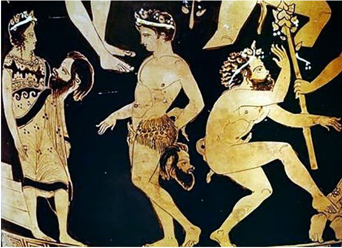
Abbildung 13: Apulischer Volutenkrater (Pronomosvase). Pronomos-Maler. Detail. Museo Archeologico Nazionale di Napoli 3240. Um 400 v. Chr. Aus: Jelinek, Elfriede: Schnee Weiß (Die Erfindung der alten Leier).

Das beschriebene Vasendetail zeigt also sowohl die Vorstellung eines Satyrn als auch ihre theatrale Darstellung. Satyr-Choreut und mythologischer Satyr befinden sich Rücken an Rücken zueinander und haben auf den ersten Blick nicht miteinander zu tun. Und doch erscheinen sie durch die Geste der jeweils ausgestreckten Hand seltsam miteinander verbunden. Tatsächlich hat Mark Griffith darauf hingewiesen, dass die »Bühnen-Satyrn« die Interaktionen der mythologischen Satyrn auf der Pronomosvase spiegeln. 38 Wir haben es also mit einer Visualisierung der Verknüpfung von Theater/Theatralität und Mythos zu tun, die für Jelineks dramaturgisch-poetisches Verfahren konstitutiv ist. Ihr Fortschreiben des Tragischen inkludiert sowohl Mythen als auch bestimmte Lesarten dieser Mythen durch die Tragödiendichter Aischylos, Sophokles und Euripides. Die dadurch entstehenden Texte beschwören die Wirk- und Manipulationsmacht des Mediums Theater, für das Jelinek grundsätzlich schreibt.