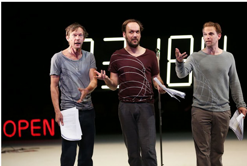
Abbildung 11: Elfriede Jelinek: Die Schutzbefohlenen . Regie: Nicolas Ste- mann. Thalia Theater Mannheim 2014.

Applaus ist, wie Bettina Brandl-Risi festgestellt hat, eine »kollektive Geste«. 85 Darüber hinaus aber handelt es sich dabei um eine Geste, die einer spezifischen Dialektik von Inklusion und Exklusion unterliegt. Diejenigen, die einer performenden Person oder Gruppe applaudieren, konstituieren sich zu einer Gemeinschaft von Huldigenden. Gleichzeitig findet just in diesem Moment eine Distanzierung zu dem emporgehobenen, gefeierten Gegenüber statt. Dabei wird eine Grenze gezogen, die im Falle der Guckkastensituation an der Rampe verläuft. Applaus kann mithin als alterisierend-nostrifizierende Geste begriffen werden, die gemeinschaftsstiftend fungiert und gleichzeitig ein Boundary Making evoziert.