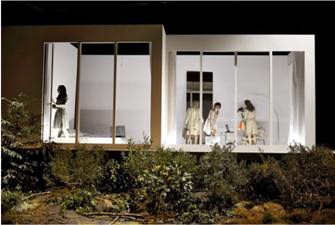
Abbildung 15: Elfriede Jelinek: Das Licht im Kasten (Straße? Stadt? Nicht mit mir!). Regie: Jan Philipp Gloger. Schauspielhaus Düsseldorf 2017.

Fragen ließe sich in diesem Zusammenhang aber auch, wie sich die Arbeitsbedingungen jener gestalten, die in Theaterinstitutionen abseits des Rampenlichts agieren. Und wie ist es überhaupt grundsätzlich um das Licht bestellt, das uns aus den Guckkästen der subventionierten Theaterhäuser entgegenleuchtet?