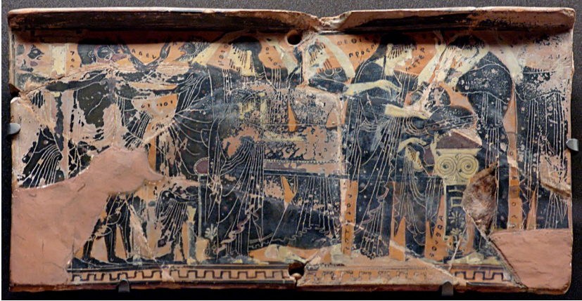
Abbildung 5: Prothesis. Schwarzfiguriger Pinax des Sappho-Malers. Louvre MNB 905. 500 v. Chr. Musée du Louvre.