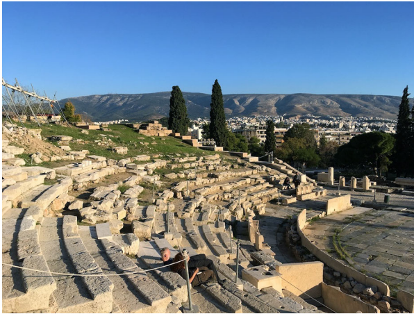
Abbildung 1: Dionysostheater Athen 2017.

Referenzpunkt zu einer Zeit, die sich im massiven Umbruch befand. Manifest wurde dieser Umbruch in den Tragödien und Komödien, die im dahinter gelegenen Dionysostheater gezeigt wurden – freilich wie gesagt für einen restriktiveren Kreis als für jenes Publikum, das sich auf den Straßen davor traf. Die Texte des Aischylos, Sophokles, Euripides und Aristophanes, die aus den Dionysischen Wettspielen so erfolgreich hervorgingen und die uns heute nach wie vor begeistern und verstören, waren Orientierungshilfen in einer Welt, die an der Schwelle zu einer neuen politischen Ordnung stand. Damals galt es, die aufkommende Idee der Demokratie auszutesten, das Verhältnis von Religion und Staat neu zu beleuchten und ethisch-moralische Dilemmata durchzudeklinieren. All die hitzigen Debatten darum, all die abfälligen Kommentare und leidenschaftlichen Plädoyers, die Aischylos und Co dazu inspirierten, diese Fragen vor der Folie der alten Mythen zu verhandeln – all dies hat sich auch in die Straßen rund um die Akropolis und die dazugehörige Architektur eingeschrieben.