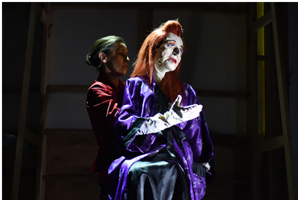
Abbildung 18: Elfriede Jelinek: Am Königsweg . Regie: Nikolaus Habjan. Landestheater Niederösterreich, St. Pölten 2019.

als Stimme der Autorin aufgefasst, als solche jedoch im Text niemals deklariert wird. Mit Katharina Pewny kann das belebte Objekt der Jelinek-Puppe mithin als Travelling Icon bezeichnet werden, d.h. als eines der vielen Motive und Objekte, »die durch die unterschiedlichen Ausdrucksformen von Jelinek und rund um sie reisen.« 159 Tatsächlich stellt Habjans Handpuppe nicht nur Verknüpfungen zwischen unterschiedlichen Jelinek-Inszenierungen her, sondern vernetzt auch unterschiedliche Medien und Textsorten (wie etwa Theatertext und Preisrede) miteinander. Ähnlich verhält es sich mit der unverkennbaren Jelinek-Perücke, die seit Nicolas Stemanns Uraufführung von Das Werk am Wiener Burgtheater (2006) gewissermaßen von Inszenierung zu Inszenierung reist und dabei mit unterschiedlichen Bedeutungen aufgeladen wird.