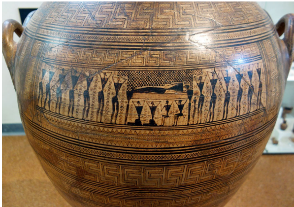
Abbildung 3: Prothesis. Bauchamphora Athen. NM 804. Mitte 8. Jh. v. Chr.

Begräbnisse waren also Gelegenheiten, die es nicht nur Männern ermöglichten, aktiv am öffentlichen Leben teilzunehmen. Der Tod und die von der Gesellschaft hochgehaltenen Rituale rund um ihn fungierten als gate opener für die attische Frau der gehobenen Mittelschicht, die ihr Leben grundsätzlich hauptsächlich innerhalb des eigenen oikos bzw. in dessen unmittelbarer Nachbarschaft verbrachte. Sie hatte sich quasi ausschließlich den häuslichen Pflichten zu widmen und war vom öffentlichen und militärischen Leben weitgehend ausgeschlossen. Rechtsautonomie auszuüben war Frauen im antiken Athen nicht möglich, sie konnten normalerweise keine sozialen und ökonomischen Entscheidungen ohne die Aufsicht eines Vormunds treffen. Die Teilnahme an politischen Versammlungen wurde ihnen ebenso verweigert wie die Aussage im Rahmen von Gerichtsprozessen. Außerdem verfügten Frauen über keinen Bürgerstatus. 23 Diese scharfe Grenze zwischen der männlich dominierten polis und jener der Frau zugewiesenen häuslichen Sphäre des oikos war im Zuge der Totenzeremonien verwischt. Ihre dominante Rolle im Totenkult verlieh der Frau eine spezifische Agency, über die sie im Alltag gemeinhin nicht verfügte.