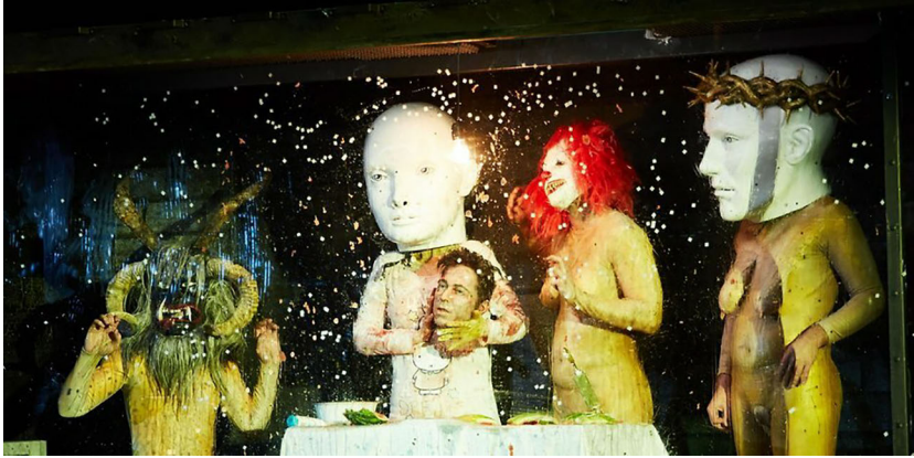
Abbildung 20: Elfriede Jelinek: Schnee Weiß ( Die Erfindung der alten Leier ). Regie: Stefan Bachmann. Schauspiel Köln 2018.

sowie die Ausstatter*innen Jana Findeklee und Joki Tewes für die Uraufführung von Schnee Weiß . Sie statteten sämtliche Darsteller*innen mit übergroßen Köpfen aus, die die darunter agierenden Körper jeweils grotesk verformten. Groteske Körperlichkeit evozierten zudem die Ganzkörperanzüge, die in dieser Inszenierung eingesetzt wurden und die mit den daran angebrachten Brüsten und Penissen an die stage nakedness der Alten Komödie erinnerten.