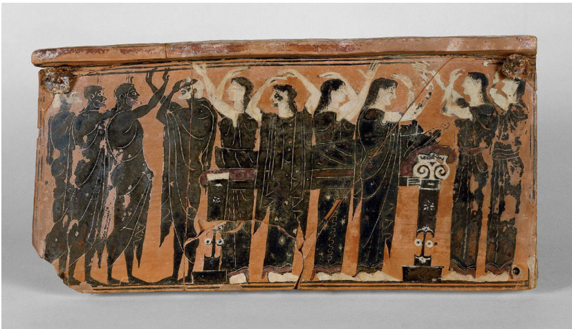
Abbildung 6: Prothesis. Schwarzfiguriger Pinax. KHM IV 4398. 510 v. Chr.

Vor allem aber unterscheiden sich die volatilen Gesten der Frauen radikal von der statischen Performance, die wir bei den abgebildeten Männern beobachten können. Diese heben – wie für den Totenkult der damaligen Zeit typisch – lediglich einen rechten Arm. Der Gendergap, der sich aus der