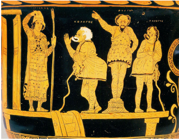
Abbildung 19: Rotfiguriger Volutenkrater (Choregosvase). Malibu-Maler. Detail. Um 400 v. Chr.

bodies« 167 gesellschaftlich stigmatisierter Menschen zu orientieren, wie Alan Hughes festhält: »Such men were kukus, physically and morally inferior. Their untended bodies and public privates implied a lack of self-respect.« 168