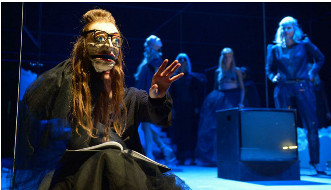
Abbildung 17: Elfriede Jelinek: Schatten (Eurydike sagt). Regie: Matthias Hartmann. Burgtheater Wien 2013.

[...] ich habe keine Werke, ich werde nie Werke haben, wie schön!, keine Werke mehr, versprochen!, ich hatte ja nie welche und werde keine mehr haben, niemand sieht meine Werke, niemand hat sie je gesehen, sie sind nichts, sie sind Dreck, mein Werk ist Dreck, und ich bin das Dunkel dazu, das über sie wacht, über die Werke im Dunkel wacht, das Nichts wacht über den Dreck, und ich bin das dazugehörige, dazu passende Dunkel, umstanden von noch mehr finsternem Schattengebäu. 157