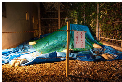
Abbildung 9: Elfriede Jelinek: Kein Licht. Epilog? Regie: Akira Takayama. Festival/Tokyo 2012.