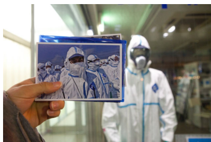
Abbildung 7: Elfriede Jelinek: Kein Licht. Epilog? Regie: Akira Takayama. Festival/Tokyo 2012.

präsentierte sich den Teilnehmenden zudem jeweils die Rekonstruktion eines der Postkartenfotos: Männer in Schutzanzügen. Verlassene Häuser. Die zurückgelassenen Habseligkeiten ihrer Bewohner. Evakuierte, die für Proviant anstehen. Ein Zusammentreffen zwischen der japanischen Regierung, Verantwortlichen von TEPCO und Bewohner*innen Fukushimas. Etc.