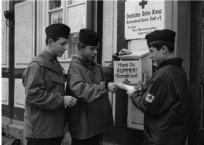
»Kummerkasten« des Jugendrotkreuzes 1956 in Goslar: Sorgen werden von den Bürgern abgelegt, von den Jugendlichen aufgelesen und bearbeitet: Ein Vorläufer der heute diskutierten »Sorgenden Gemeinschaften«.

offen stehen. Denn sie sind zumindest teilweise im Rahmen der Sozialgesetzbücher refinanziert und dürfen gar nicht diejenigen ausschließen, deren »Maß der Not« im Einzelfall vielleicht nicht ganz an oberster Stelle stehen mag.