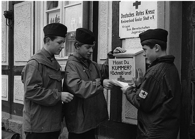
»Kummerkasten« des Jugendrotkreuzes 1956 in Goslar: Sorgen werden von den Bürgern abgelegt, von den Jugendlichen aufgelesen und bearbeitet: Ein Vorläufer der heute diskutierten »Sorgenden Gemeinschaften«.

offen stehen. Denn sie sind zumindest teilweise im Rahmen der Sozialgesetzbücher refinanziert und dürfen gar nicht diejenigen ausschließen, deren »Maß der Not« im Einzelfall vielleicht nicht ganz an oberster Stelle stehen mag.