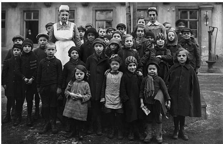
Die »Vaterländischen Frauenvereine vom Roten Kreuz« stellen den Beginn der DRK-Wohlfahrtspflege dar. Auf dem Bild ein vaterländischer Frauenverein von 1924.

Die Gliederungen des Deutschen Rotes Kreuz engagieren sich stark für diesen Personenkreis. Aber die Wirklichkeit der Rotkreuz-Wohlfahrtsarbeit geht weit darüber hinaus. Das Deutsche Rote Kreuz betreibt Dienste und Einrichtungen, die allen Pflegebedürftigen, allen Kindern und Jugendlichen, allen Kranken, allen Menschen mit Behinderungen