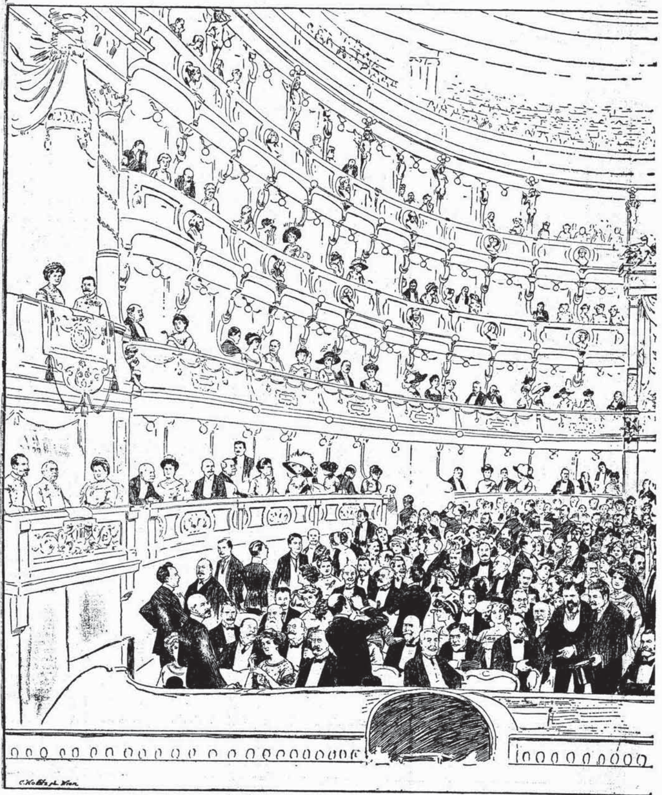
Abb. 1: Suchbild: Bahr, Berger, Hofmannsthal, Schnitzler und – ganz Wien. In: Neues Wiener Journal 6170, 25. Dezember 1910

Originalzeichnung für das „Neue Wiener Journal“