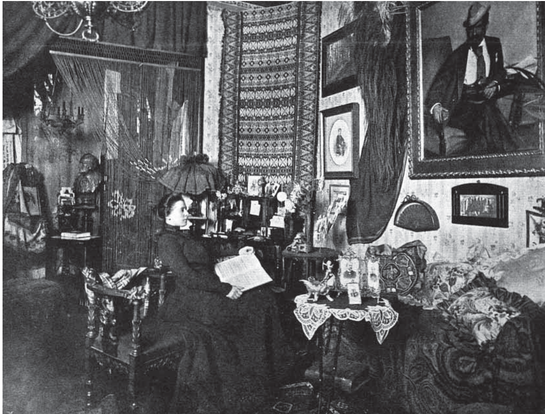
Abb. 4: Marie Gutheil-Schoder in ihrem Wohnhaus. In: Wiener Bilder. Illustriertes Familienblatt 28, 1901

Weimar, das voll der glorreichsten Erinnerungen ist. Aber sie lebte zuerst ein Leben der Zurückgezogenheit in dem stillen, vornehmen Elternheim, in dem konservative Anschauungen herrschten. Als eine aus der Art Geschlagene erschien sie, als sie von einer frühen Leidenschaft für Musik erfaßt, den festen Entschluß ausdrückte, sich der Bühne zu widmen. Das war eine Leidenschaft, die ihr wie zugeflogen kam in dem Hause, in dem kein einziges Mitglied eine starke künstlerische Neigung hegte, 3 in einem Leben, das ohne jedes außerordentliche Ereignis war. Marie liebte das Theater, liebte diese bunte, farbige und imaginäre Welt auf den Brettern, ihre Tragik und ihre Heiterkeit und den tiefen Sinn, den das Leben hier bekommt. Eines Tages fühlte sie ihren inneren Beruf, fühlte ihn unabweisbar in sich und sah sich in einen Kampf gestellt gegen die elterliche Abneigung. Sie besiegte sie schließlich und konnte sich in Dresden zuerst ihrer musikalischen Ausbildung widmen. Aber