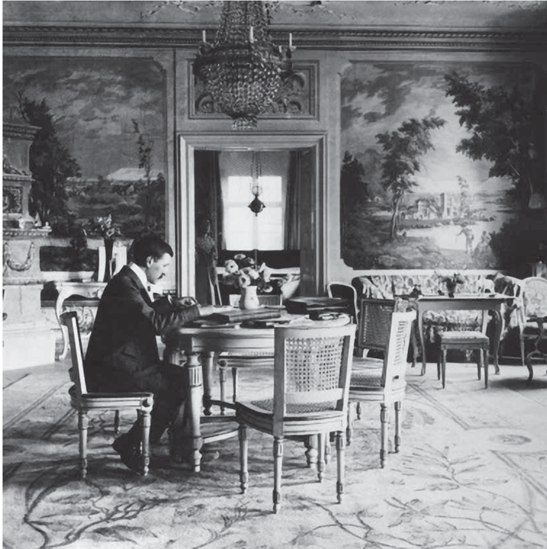
Abb. 2: Hofmannsthal in Rodaun, Photographie vor 1907