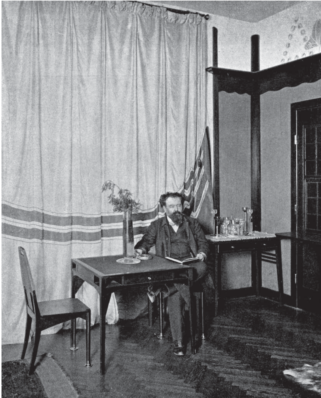
Abb. 3: Hermann Bahr im Speisezimmer seiner Villa. In: Das Interieur II, 1901, S. 164