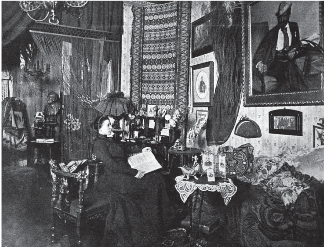
Abb. 4: Marie Gutheil-Schoder in ihrem Wohnhaus. In: Wiener Bilder. Illustriertes Familienblatt 28, 1901

Weimar, das voll der glorreichsten Erinnerungen ist. Aber sie lebte zuerst ein Leben der Zurückgezogenheit in dem stillen, vornehmen Elternheim, in dem konservative Anschauungen herrschten. Als eine aus der Art Geschlagene erschien sie, als sie von einer frühen Leidenschaft für Musik erfaßt, den festen Entschluß ausdrückte, sich der Bühne zu widmen. Das war eine Leidenschaft, die ihr wie zugeflogen kam in dem Hause, in dem kein einziges Mitglied eine starke künstlerische Neigung hegte, 3 in einem Leben, das ohne jedes außerordentliche Ereignis war. Marie liebte das Theater, liebte diese bunte, farbige und imaginäre Welt auf den Brettern, ihre Tragik und ihre Heiterkeit und den tiefen Sinn, den das Leben hier bekommt. Eines Tages fühlte sie ihren inneren Beruf, fühlte ihn unabweisbar in sich und sah sich in einen Kampf gestellt gegen die elterliche Abneigung. Sie besiegte sie schließlich und konnte sich in Dresden zuerst ihrer musikalischen Ausbildung widmen. Aber