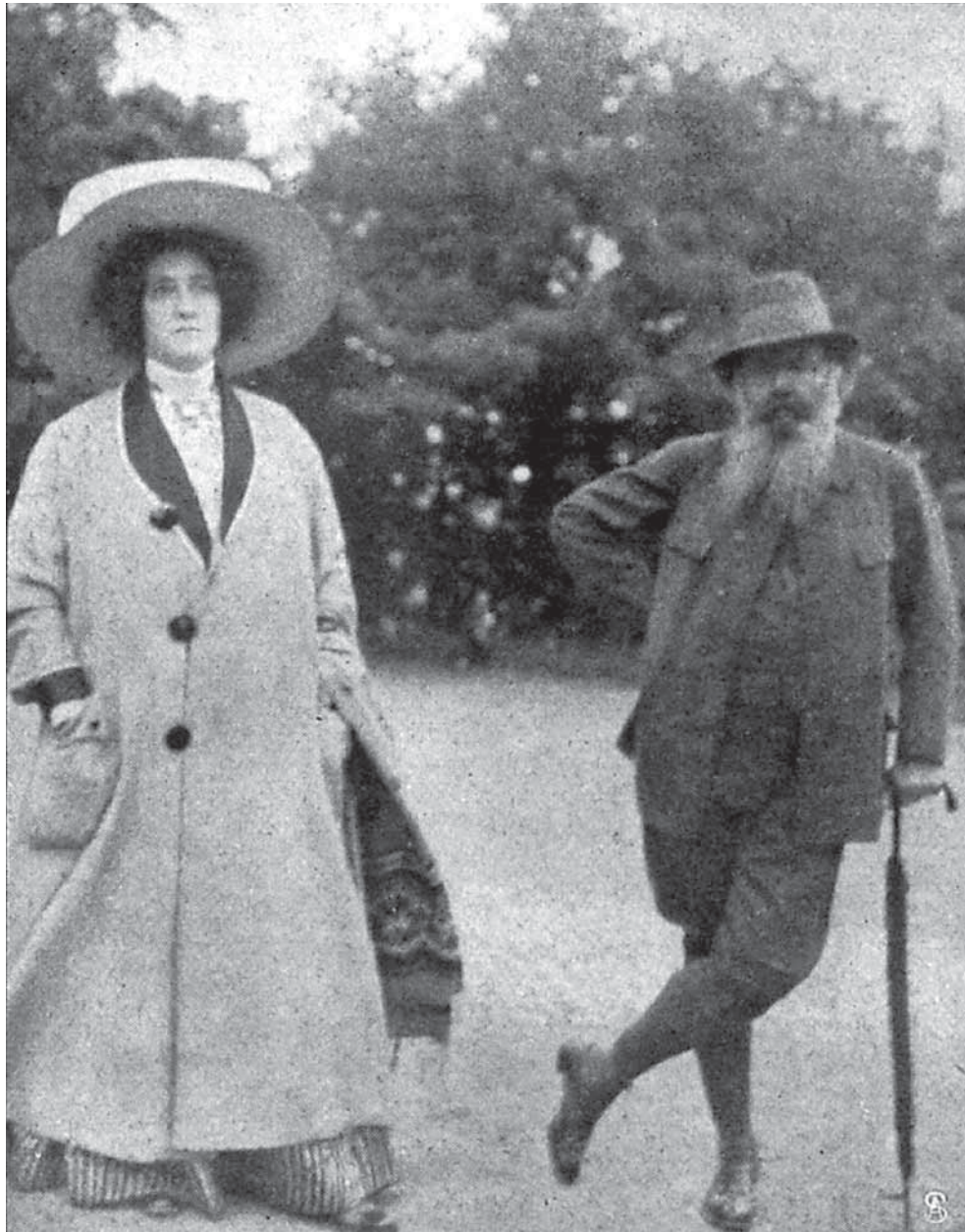
Abb. 5: Anna Bahr-Mildenburg mit Hermann Bahr. In: Die Woche 33, 1910, S. 1381.