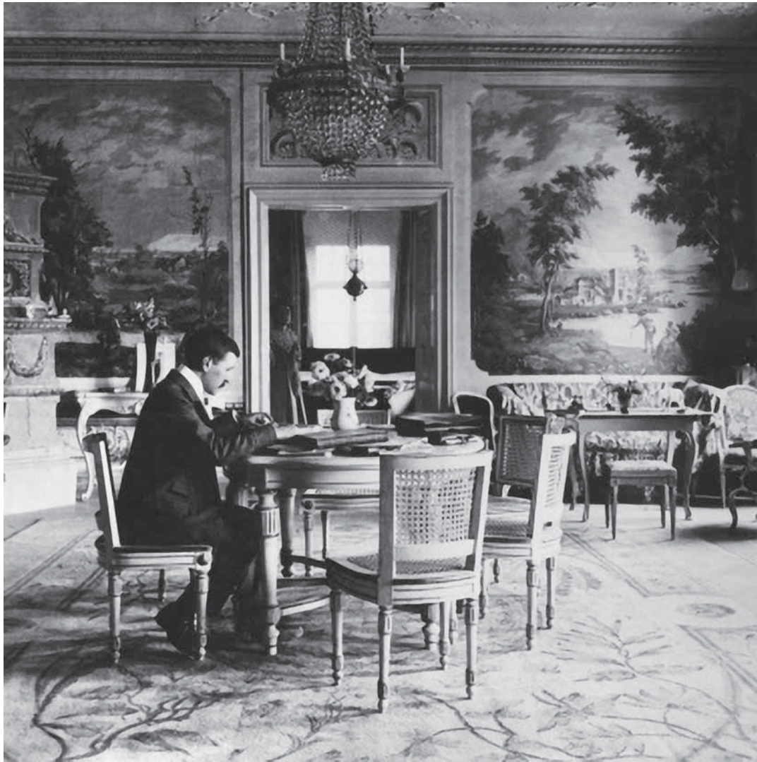
Abb. 2: Hofmannsthal in Rodaun, Photographie vor 1907