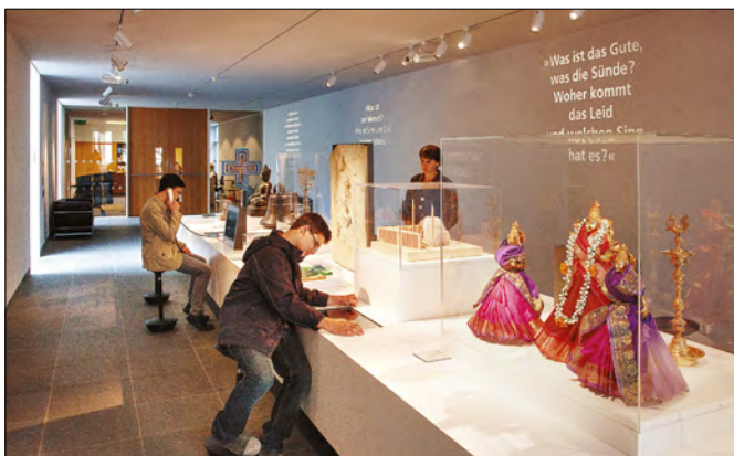
Abb. 2: Tisch der Religionen im Erdgeschoss des Museumsneubaus.

Das Ensemble zu Religionen ist durch Glastüren in einer Glaswand abgetrennt, so dass Besucher:innen ihm als erstes Museumsobjekt begegnen: »Jeder, der ins Museum geht, umrundet den Tisch« 3 , so die Museumsleiterin auf die Frage, wie der Tisch von den Besucher:innen wahrgenommen wird. Der Tisch der Religionen ist ein sehr langer, mittig im schmalen, langgestreckten Raum stehender, weißer, podestartiger Kubus (Abb. 2). Auf diesem befinden sich viele einzelne Artefakte in unterschiedlichen Größen, Farben und Materialien sowie auf verschiedenen Höhen arrangiert. Sie sind zum Teil in Plexiglastischen verpackt. Durch ihre Ausrichtung auf die im Raum umhergehenden Besucher:innen laden sie dazu ein, an dem Tisch entlangzugehen.