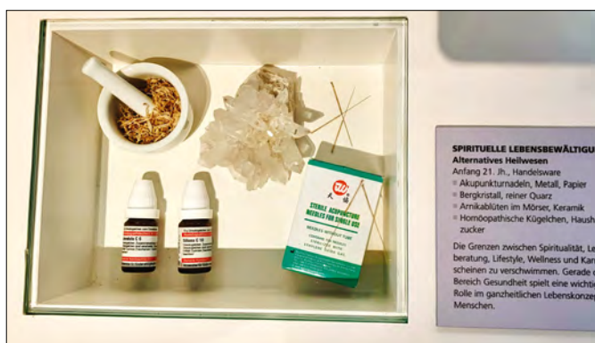
Abb. 4: Spirituelle Lebensbewältigung, Alternatives Heilwesen, Tisch der Religionen.

So werden andererseits auf dem Tisch der Religionen auch Ausstellungsstücke jenseits des Konzeptes der Weltreligionen dargeboten, die sich als Ausdruck eines religions- bzw. kulturwissenschaftlich erweiterten Religionsverständnisses lesen lassen. So findet sich auf dem Tisch etwa ein Plexiglaskasten, der sich der »Spirituellen Lebensbewältigung« durch »Alternatives Heilwesen« widmet und dazu einen Keramikmörser mit Kräutern, einen Bergkristall, Akupunkturnadeln und Globuli-Gläser zeigt (Abb. 4). Schon diese Zusammenstellung vereint sehr disparate Traditionen der euro-