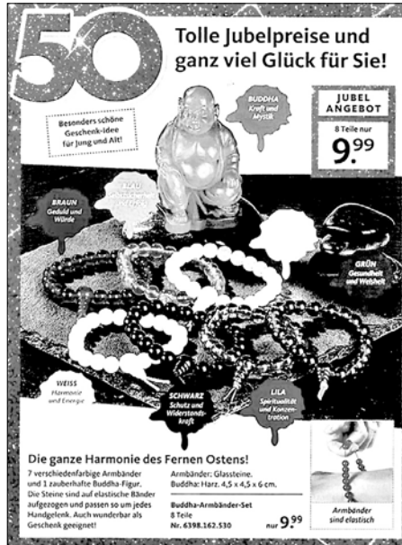
Abb. 10: Buddha-Armbänder-Set. Foto: Walz Verlag, Versandkatalog »Die moderne Hausfrau«.