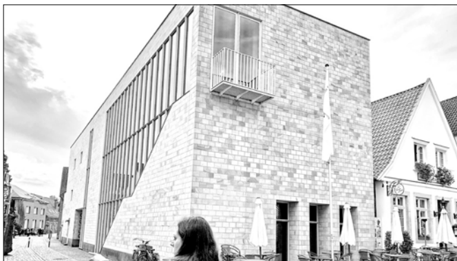
Abb. 1: Neubau des Museums RELiGIO in Telgte mit Haupteingang links und dem »Tisch der Religionen« im Erdgeschoss.

Das Ensemble zu Religionen ist durch Glastüren in einer Glaswand abgetrennt, so dass Besucher:innen ihm als erstes Museumsobjekt begegnen: »Jeder, der ins Museum geht, umrundet den Tisch« 3 , so die Museumsleiterin auf die Frage, wie der Tisch von den Besucher:innen wahrgenommen wird. Der Tisch der Religionen ist ein sehr langer, mittig im schmalen, langgestreckten Raum stehender, weißer, podestartiger Kubus (Abb. 2). Auf diesem befinden sich viele einzelne Artefakte in unterschiedlichen Größen, Farben und Materialien sowie auf verschiedenen Höhen arrangiert. Sie sind zum Teil in Plexiglastischen verpackt. Durch ihre Ausrichtung auf die im Raum umhergehenden Besucher:innen laden sie dazu ein, an dem Tisch entlangzugehen.