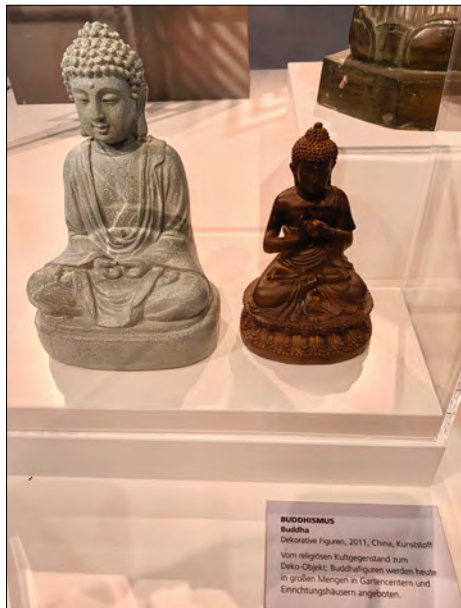
Abb. 8: Zwei Buddhafiguren auf dem Tisch der Religionen im Museum RELÍGIO, Telgte.

Im RELÍGIO Museum wird der historische Wandel bei mehreren Objekten thematisiert. So befinden sich am Tisch der Religionen auf einem kleinen weißen Podest unter einer Plexiglashaube zwei Buddhafiguren, auf deren Schildchen steht (Abb. 8):