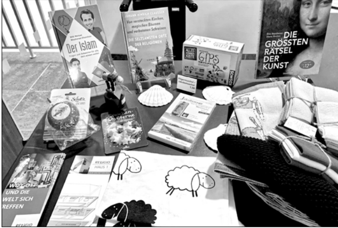
Abb. 5a: Kleiner Shop-Tisch gleich am Eingang des Neubaus des Museums (2021).

terialität und der Affordanz von Klappenelementen für Fragen der Aneignung und zur didaktischen Anregung eines individuell-existenzialeren Zugangs, der die religionskundliche Performanz ergänzt. 8 In diesem Bildungsmaterial findet sich auch ein Bastelanleitungsbuch, ein Spiel sowie Bildkartensets zu Weltreligionen.