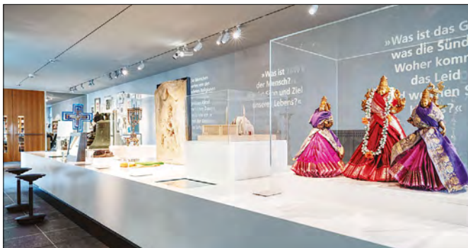
Abb. 7: Das Moscheemodell im Kontext (2021).

Dieser abrahamitischen Logik und Chronologie folgend wurde das Moscheemodell als zentrales Objekt des Islams rechts neben der Menora, dem siebenarmigen Leuchter, für das Judentum und dem Bildstock für das katholische Christentum platziert, das den Mittelpunkt des Tisches bildet, womit für die umrundenden Betrachtenden zugleich auch die zeitliche Abfolge ihrer Entstehung angezeigt wird. Dieses jüdisch-christlich-islamische Kernensemble wird erweitert durch Objekte weiterer Religionen wie linkerhand mit Buddhafiguren und rechterhand mit Figuren aus Hindu-Religionen (Abb. 7).