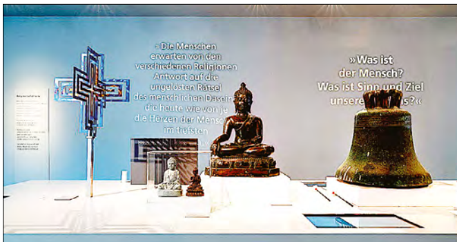
Abb. 3: Kulturhauptstadtkreuz von Benediktinerpater Abraham Fischer, Buddha-Figuren, Kirchenglocke aus einer entwidmeten evangelischen Kirche.

Mittig im Raum befindet sich der Tisch der Religionen und versinnbildlicht einerseits »das symbolische Zusammentreffen der Weltreligionen« 6 . Betritt man den Raum und geht auf den Tisch zu, begegnet man dort am Kopf des Tisches zuerst einem christlichen Kreuz, gefertigt von einem Künstler. In Größe, Farbigkeit und Erhöhung thront es geradezu über den anderen Objekten, insbesondere über den beiden Buddhas in direkter Nachbarschaft rechterhand. Dieser Eindruck wird noch verstärkt durch eine daneben positionierte Kirchenglocke, die aus einer entwidmeten evangelischen Kirche stammt (Abb. 3). Geht man den Tisch weiter ab, findet man in der Mitte