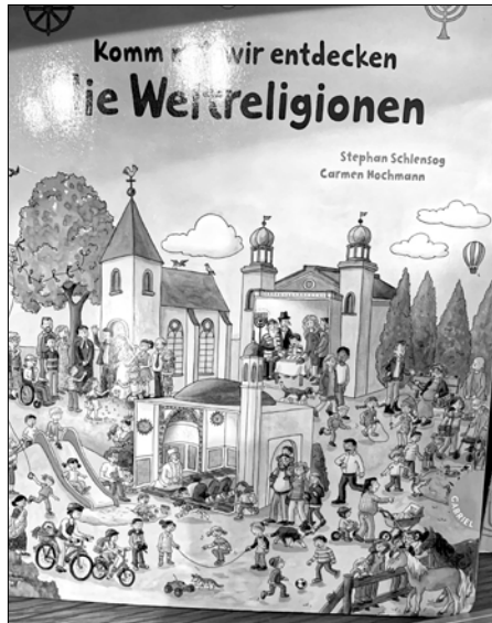
Abb. 5b: Kinderbuch zu Weltreligionen von Stephan Schlenz und Carmen Hochmann im Gabriel Verlag 2019.