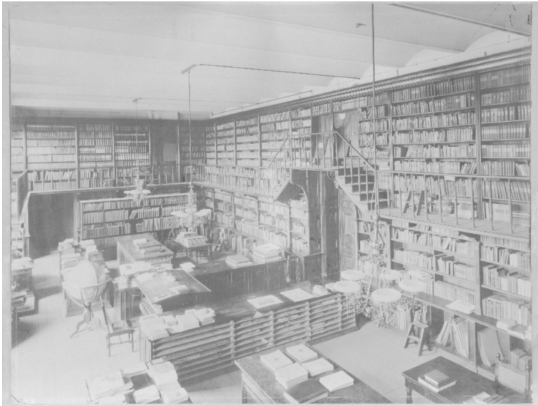
Abbildung 3: Aufnahme des Bibliotheksraums.