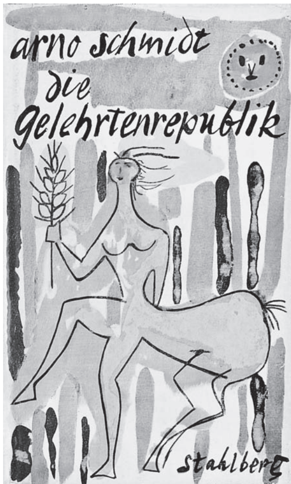
Erstausgabe 1957, Stahlberg Verlag

Die bestürzend geringe Benutzung der Bibliothek ist – verglichen mit unserer heutigen Bibliothekswirklichkeit – nicht nur ein weiterer utopischer Zug; sie hat darüber hinaus unlegbar satirischen Charakter. Die vier Leser-Karikaturen stellen einen kritischen Seitenhieb gegen die seinerzeitigen Darmstädter Künstlerkollegen Arno Schmidts dar. Wer gehörte zwischen 1955 und 1957/58 zur dortigen Künstlerkolonie? Ohne Anspruch auf Vollständigkeit seien genannt: Kasimir Edschmid, Georg Hensel, Hermann Kasack, Ernst Kreuder, Arnold Krieger, Karl Krolow, Frank Thieß und der Maler Eberhard Schlotter. Sporadische Kontakte hatte Schmidt zu Edschmid und Hensel; Kasack war für ihn (wohl nur) im »Pocahontas«-Prozeß wichtig; das Verhältnis zu Kreuder war bzw. wurde schwierig. Eine freundschaftliche Beziehung hat er eigentlich nur zu Schlotter und dessen Frau unterhalten; zu seinen Schriftstellerkollegen hat der gebürtige Hamburger – gut norddeutsch – Distanz gehalten. Hat er auf einen von diesen speziell gezielt – vielleicht auf Kreuder? Nicht nur das gespannte Verhältnis zu ihm deutet in diese Richtung, sondern auch die anscheinend ironisch gemeinte Erwähnung eines »Kreudergrüns« 18 – wie immer wir es uns vorzustellen haben. – Was die