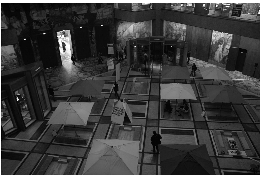
In Paris hat das neue Immigrationsmuseum seine Pforten geöffnet. Die »Cite nationale de l'histoire de l'immigration« (CNHI) hat sich zum Ziel gesetzt, den Beitrag der Immigration »zu erkennen und anzuerkennen«. Die Ausstellung gibt einen umfassenden Überblick über die sozial, wirtschaftlich oder politisch motivierten Einwanderungswellen in Frankreich der letzten zweihundert Jahre. Informationen: http://www.histoire-immigration.fr

Der Landschaftsverband Rheinland hat seinen Abschlussbericht zum Forschungsprojekt »Arbeitsassistenz zur Teilhabe« vorgelegt. Die bundesweite Studie der Leistung Arbeitsassistenz für schwerbehinderte Menschen (§ 102 Abs. 4 SGB IX) wurde im Auftrag des Landschaftsverbandes Rheinland und in Zusammenarbeit mit der Bundesarbeitsgemeinschaft der Integrationsämter und Hauptfürsorgestellen durchgeführt. Als Fazit belegt der Untersuchung die Praxistauglichkeit dieses seit Oktober 2002 bestehenden Unterstützungsangebots. Sie zeigt, dass die Leistungsfähigkeit des Menschen mit Behinderung mit Hilfe