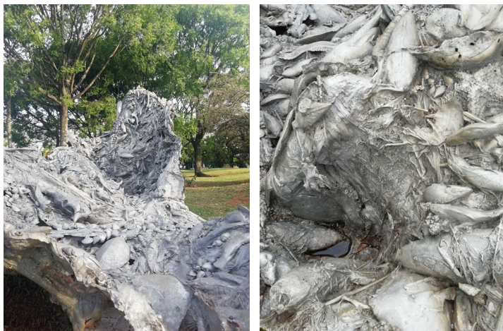
Imagen 2: Detalle de la escultura “Craca”

Imagen 1: La escultura “Craca” rodeada de árboles